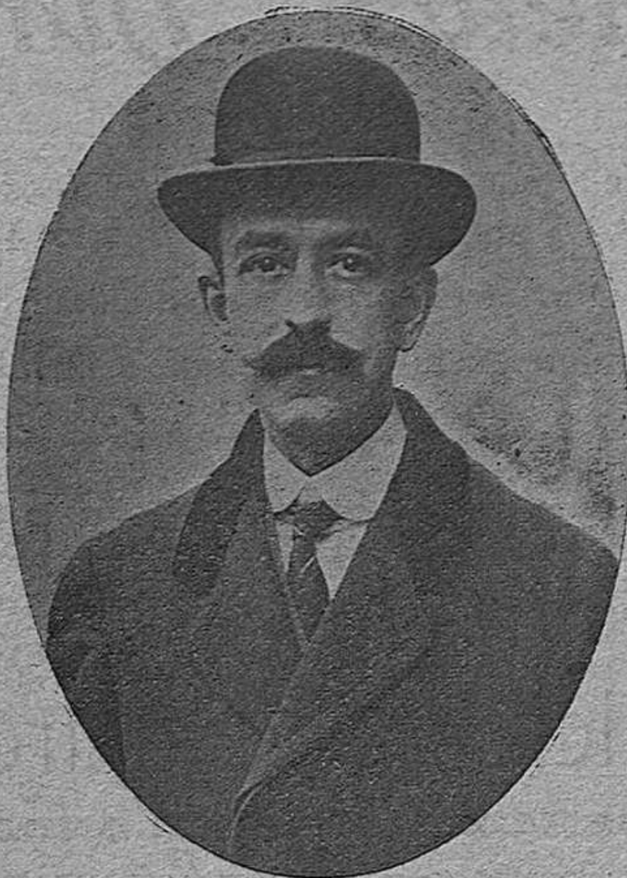
DON MANUEL FALLA

Distinguido compositor, que, en el Teatro «La Opera Cómica» de París, ha obtenido un gran éxito con su obra La vida breve , cuya letra es del también gaditano Carlos Fernández Shaw, ilustre poeta que falleció hace dos años en Madrid.