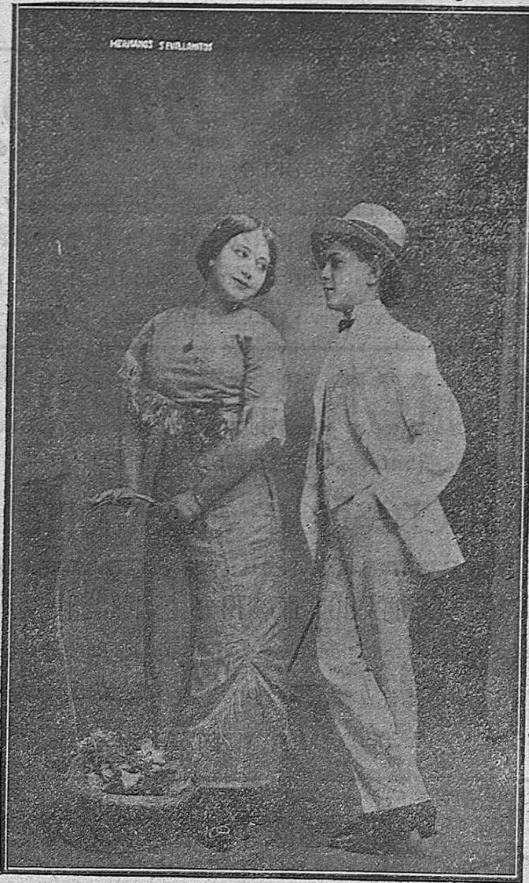
La aplaudida pareja de bailes españoles, Hermanos Sevillanitos.