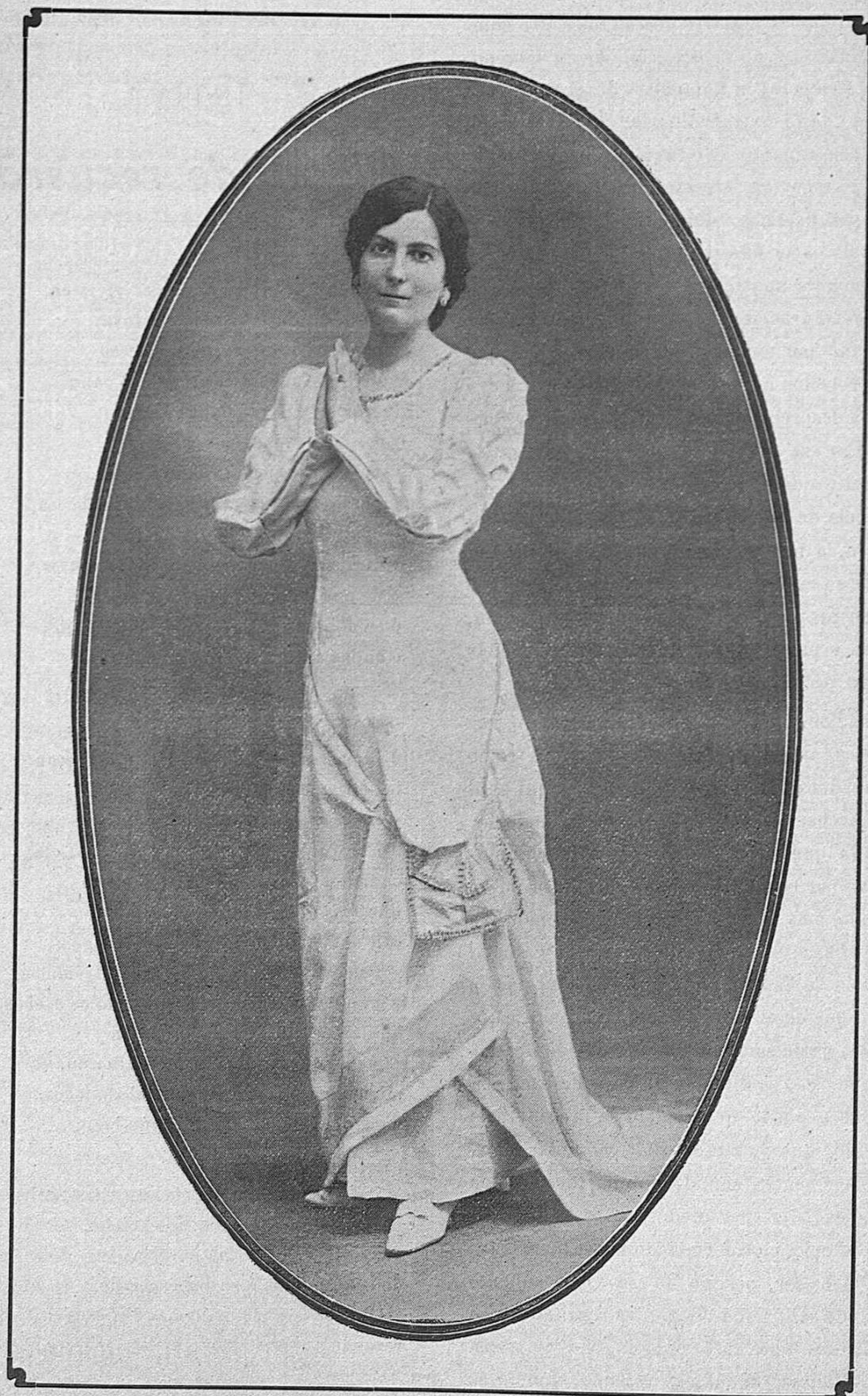
La aplaudida tiple de ópera ALBERTINA CASSONI.