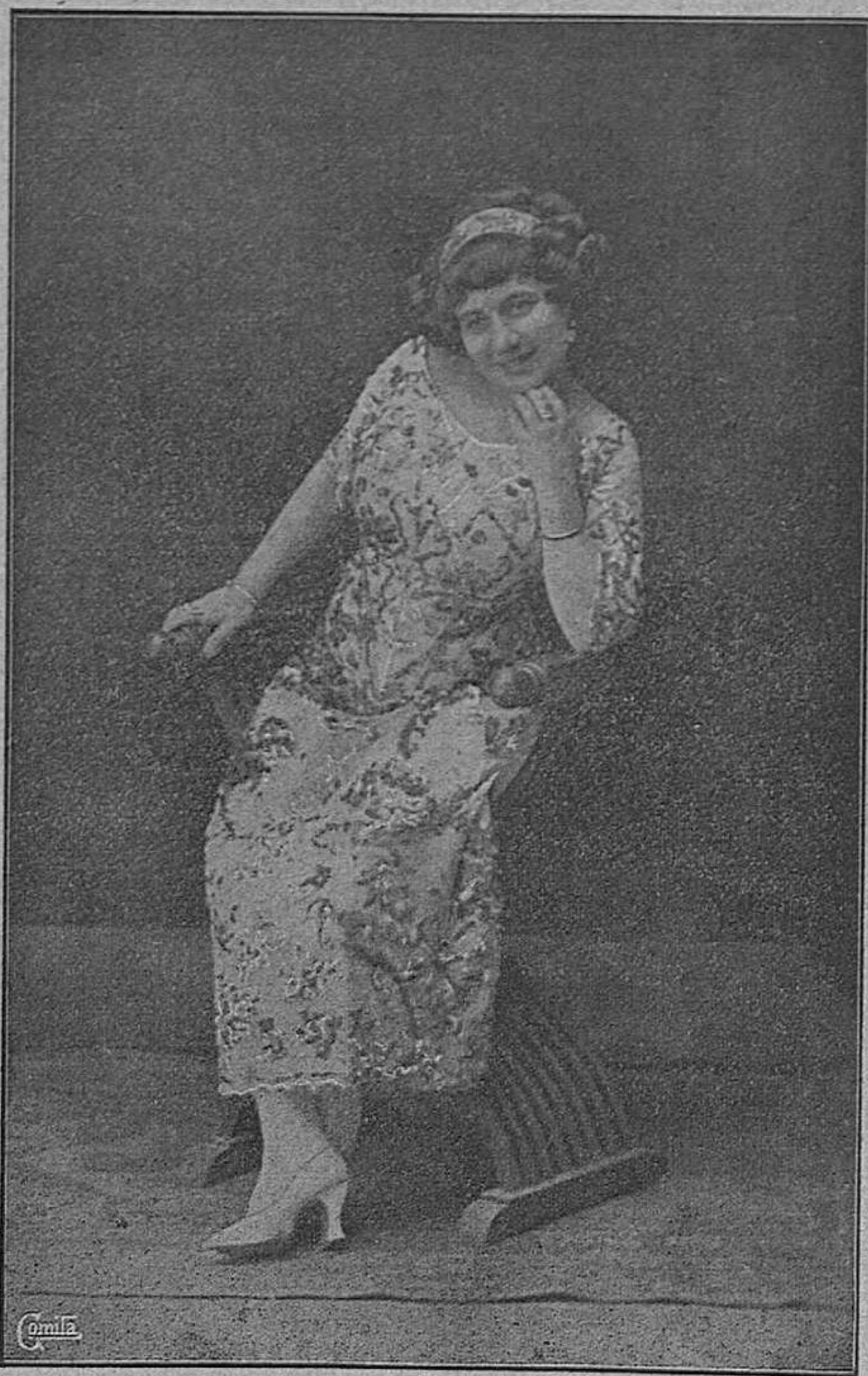
La aplaudida canzonetista FIORINA SAMPIETRI