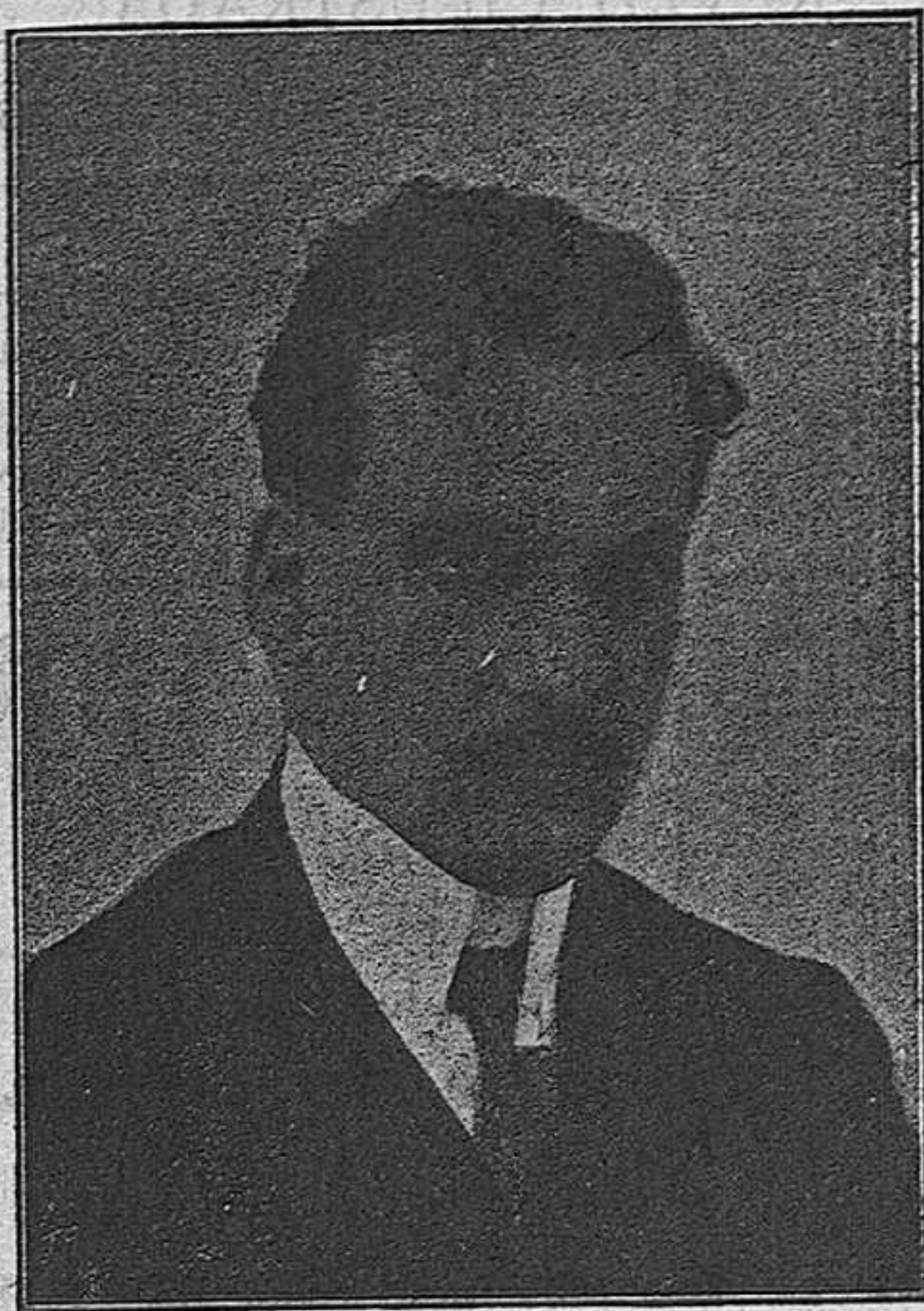
JULIO ROMERO DE TORRES