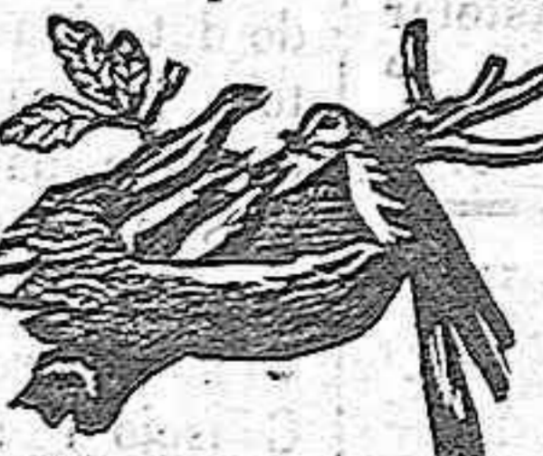
(Marca de garantía.)

ALIMENTO COMPLETO PARA LOS NIÑOS DE CORTA EDAD.