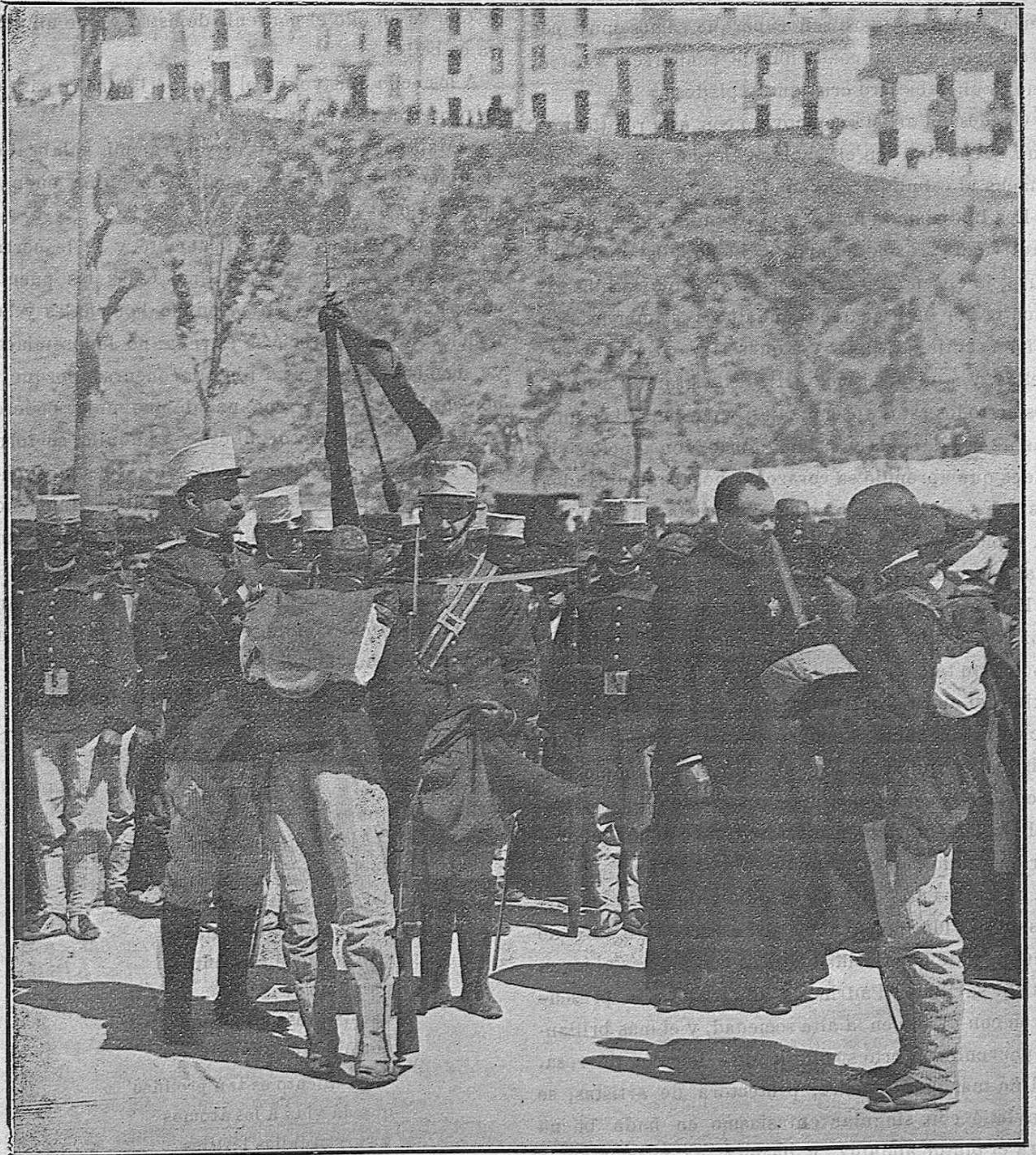
Málaga: Momento de prestar juramento, besando la cruz, un recluta del Regimiento de Extremadura.