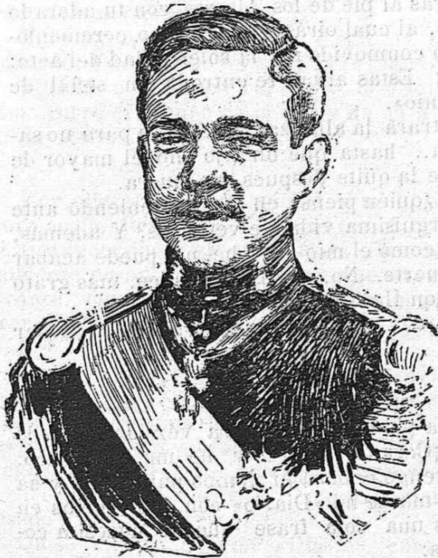
S. M. el Rey de Portugal