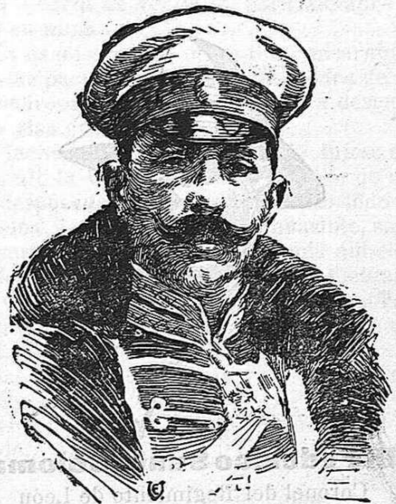
D. Jaime de Borbón