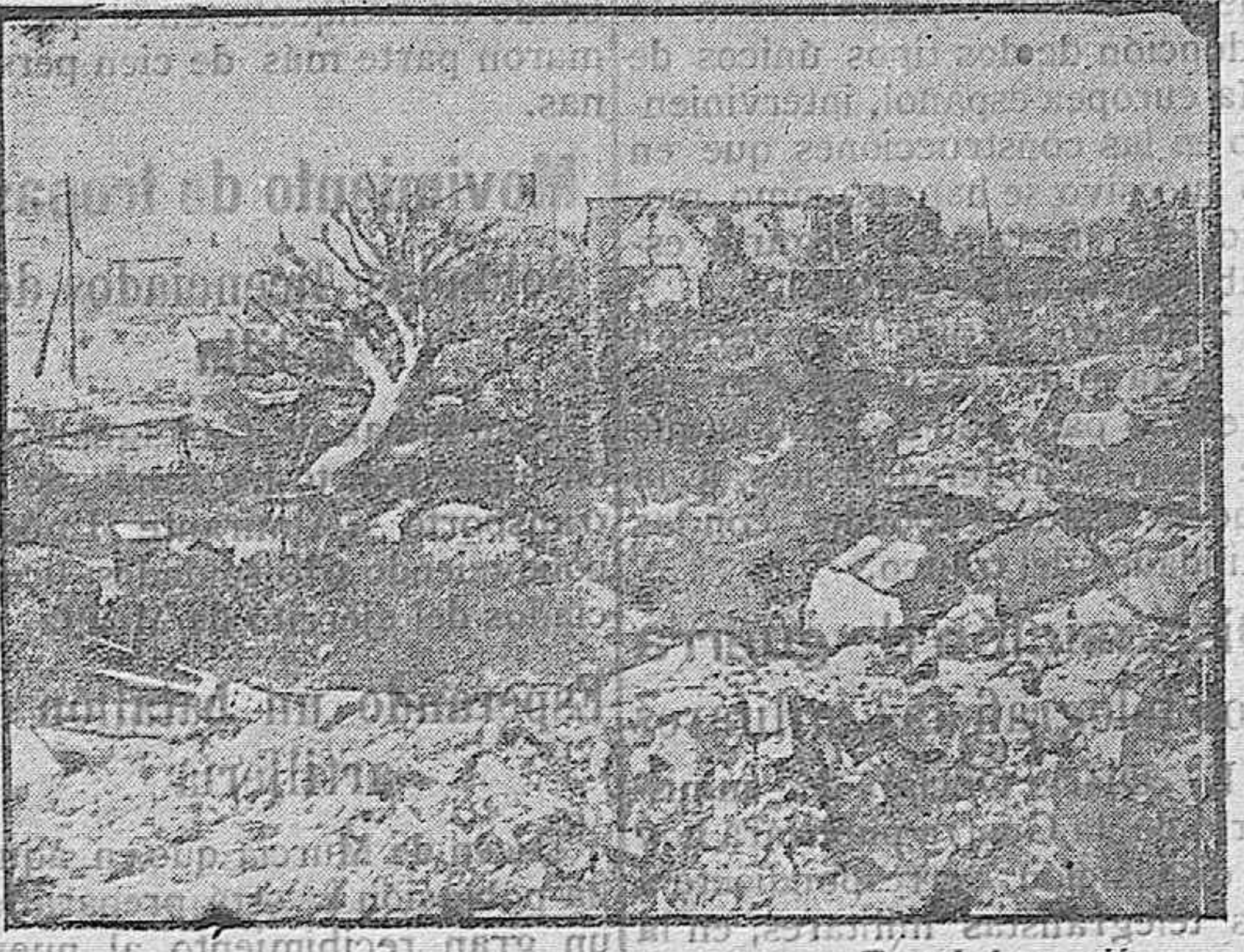
DE LA GUERRA.—Vista general de Flavy-le-Martel

CONSULTA EN CACERES todos los meses, del 20 al 30 Canalejas, 18 y 20 HORAS DE CONSULTA: DE 10 A 1