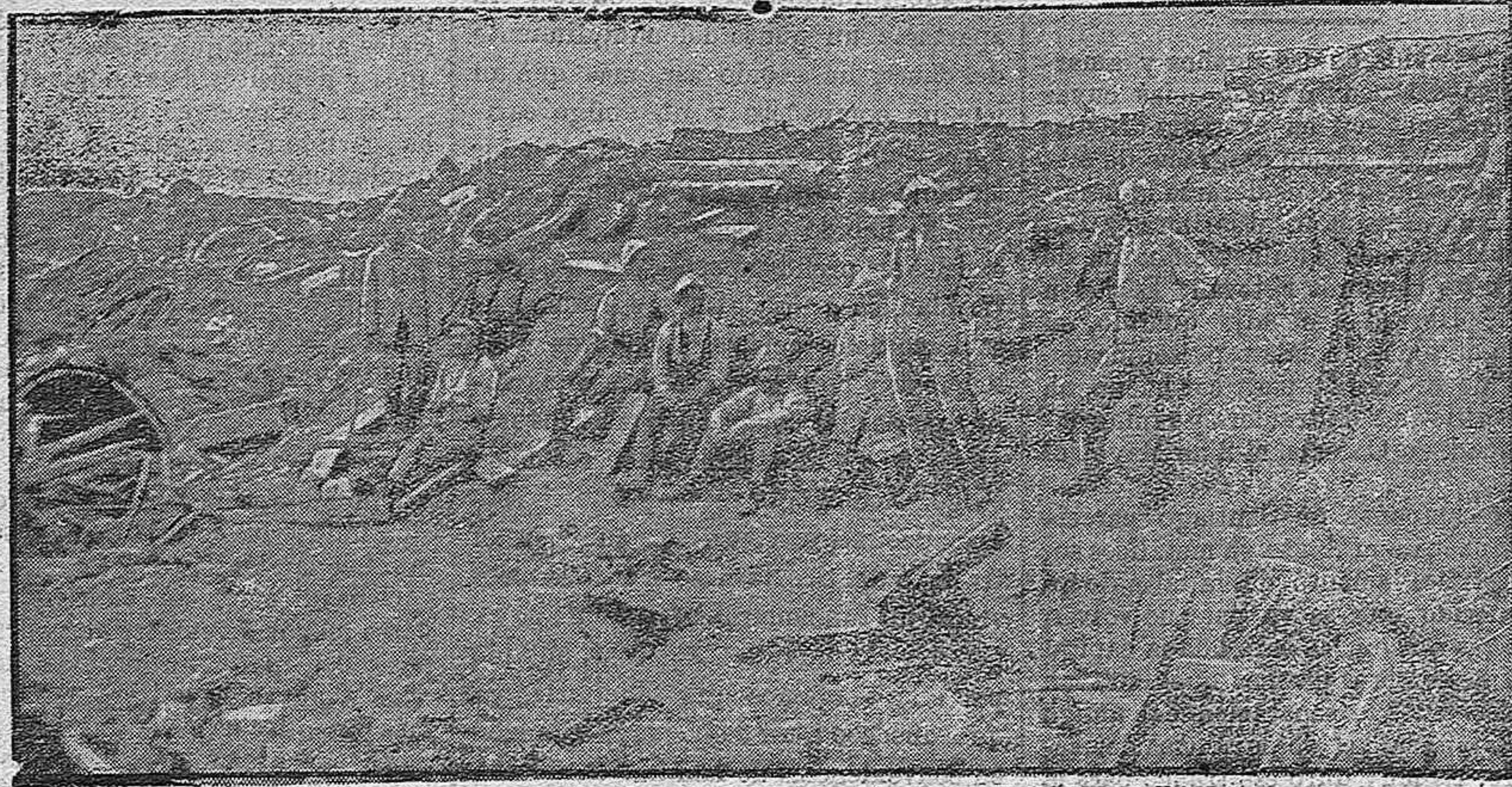
Cañón francés de trincheras y sus servidores.