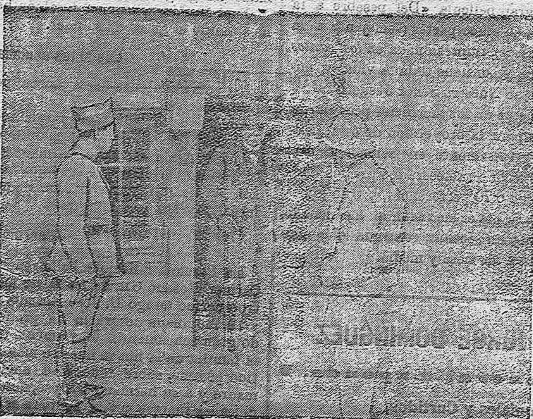
Mr. Clemenceau saliendo de una cooperativa en el frente.