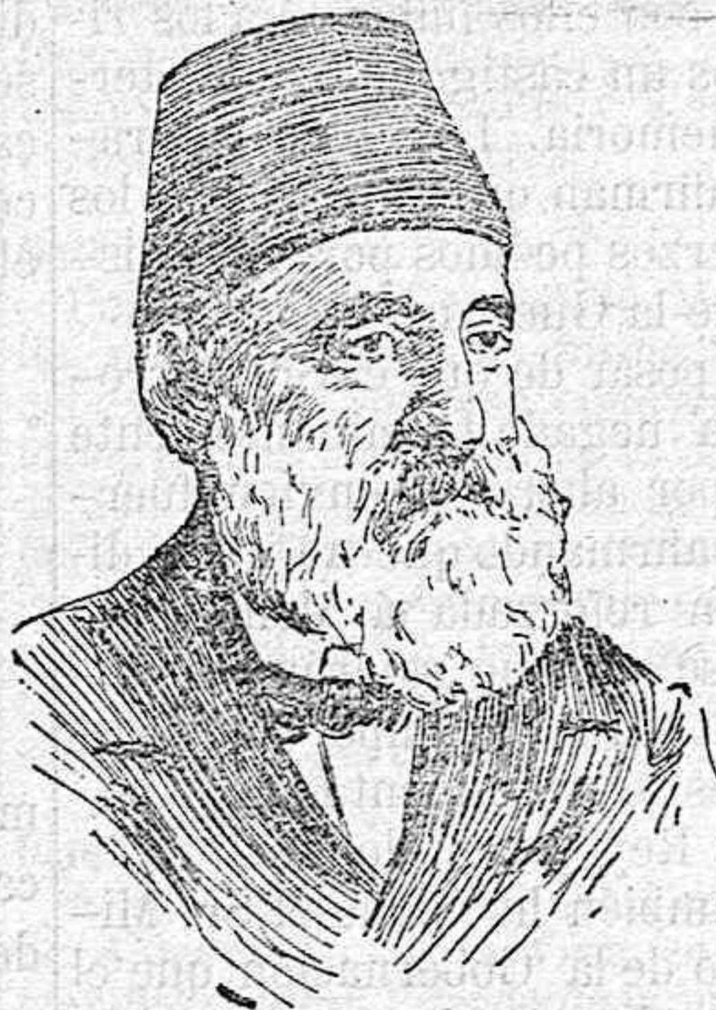
Said Kiamil Pachá.