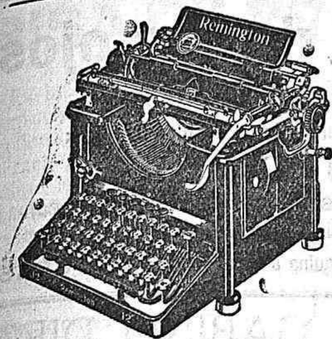
Máquina de funcionamiento silencioso

EN LOS 52 AÑOS QUE LLEVA DE PRÓSPERA EXISTENCIA LA CASA HA LOGRADO QUE SUS ÚLTIMOS MODELOS HAYAN SIDO ACLAMADOS UNIVERSALMENTE COMO LOS MÁS COMPLETOS, PRÁCTICOS Y SÓLIDOS : PIDA V. HOY MISMO CATALOGOS EXCLUSIVA DE VENTAS PARA EXTREMADURA Y SALAMANCA