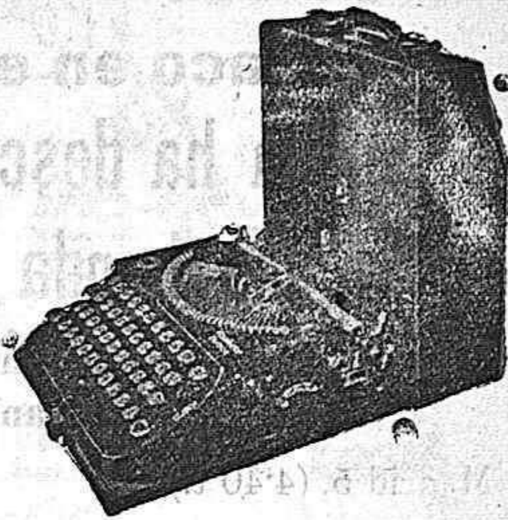
La primera máquina de escribir Portatil con teclado universal