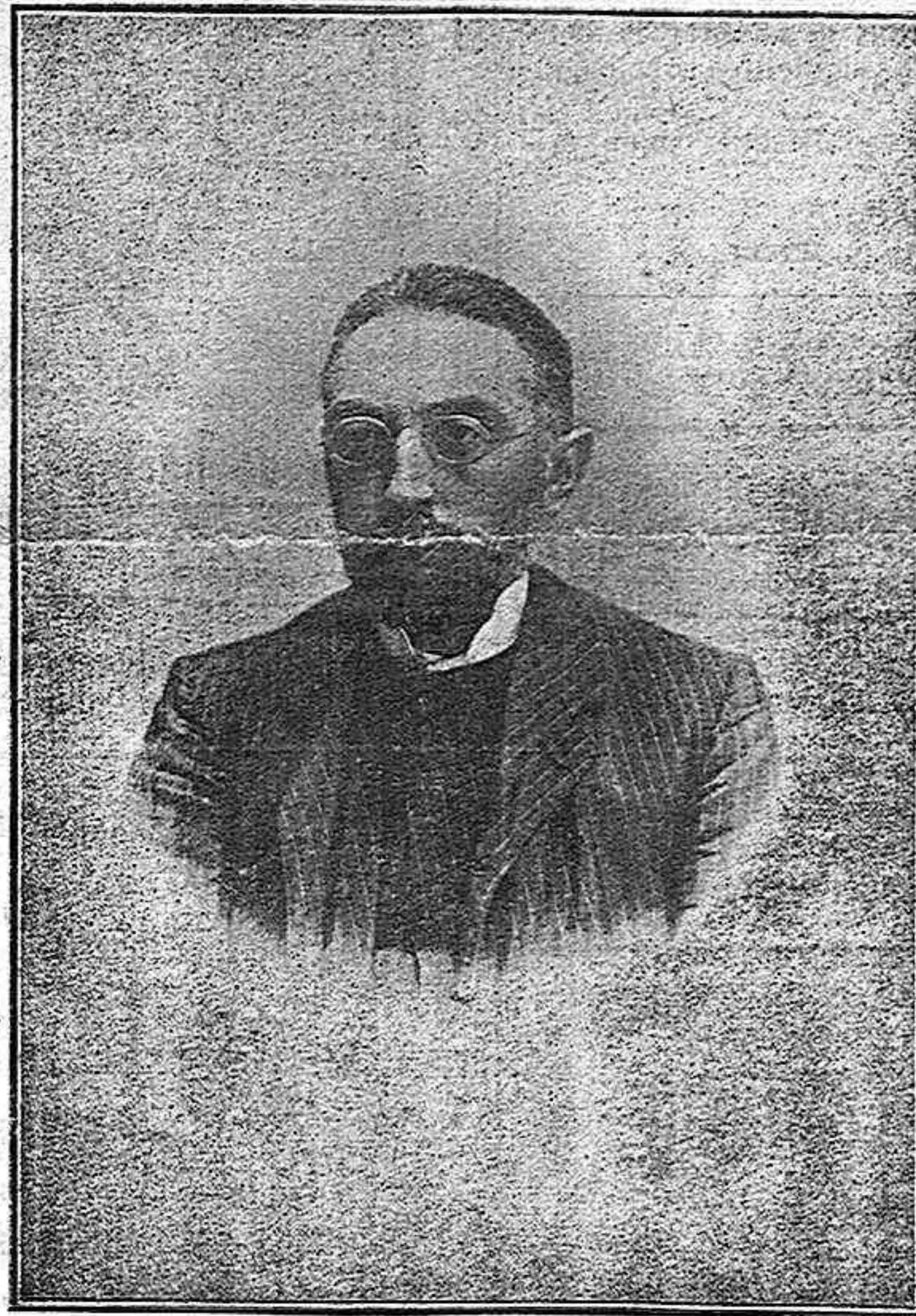
TECMO. SR. D. MIGUEL DE UNAMUNO RECTOR DE LA UNIVERSIDAD DE SALAMANCA

ca en boca, como uno de nuestros prestigios nacionales.