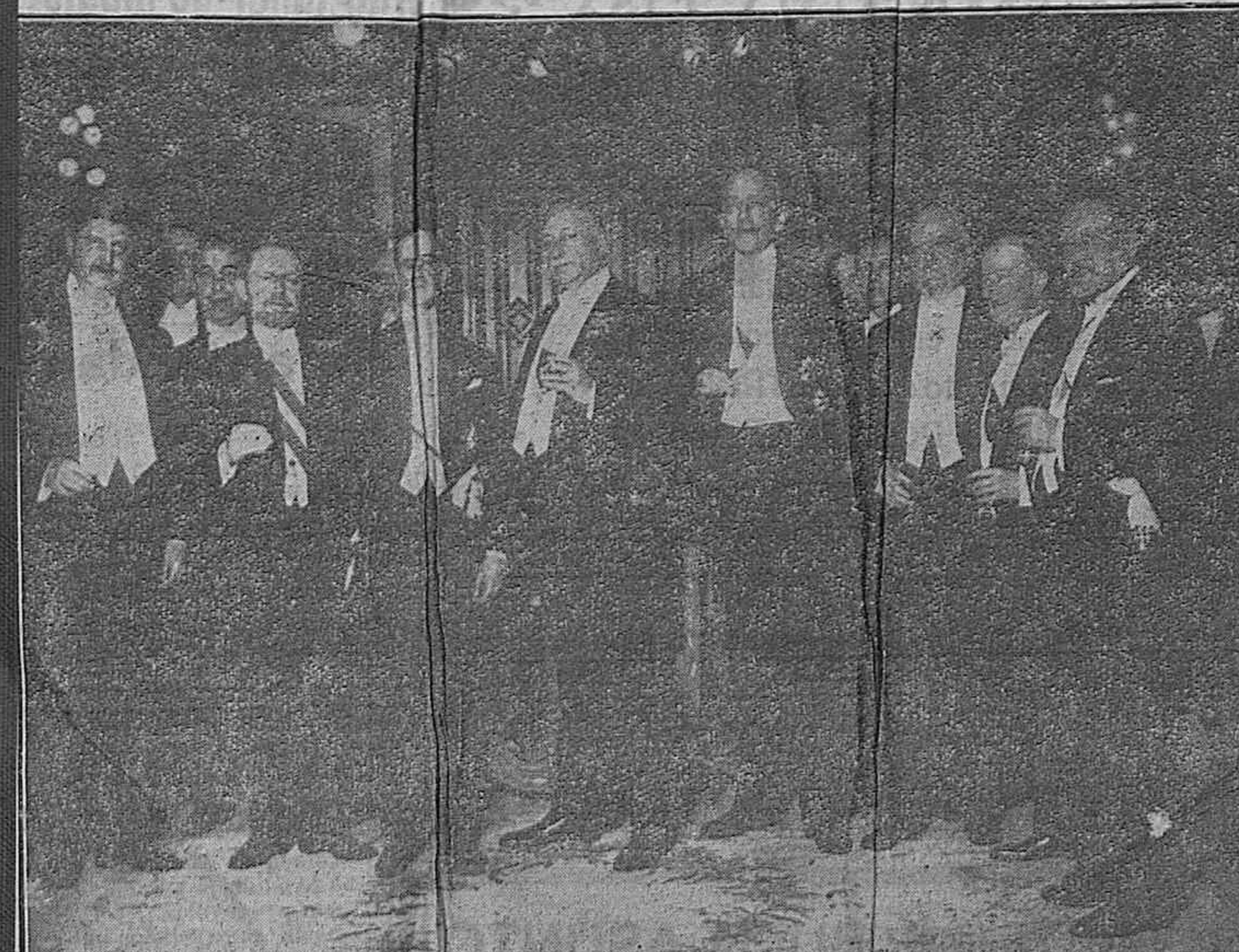
Madrid.—El general Primo de Rivera, con los representantes diplomáticos del Perú, Checoslovaquia, Polonia y Noruega, después del banquete que les fué ofrecido por el Gobierno con motivo de hacerles entrega de las plumas de oro con que fueron firmados los tratados de arbitraje y propiedad intelectual entre dichos países y España.

Tampoco en esta noche, han faltado humoristas, haciendo gala de sus tinitos inofensivos. Unos bailaban, otros jugaban al corro y otros rompían botellas, pero después de habérselas bebido. Monas y monadas, simplemente. Y mientras tanto, nuestra banda municipal lanzaba al aire lo más nuevo de su repertorio.