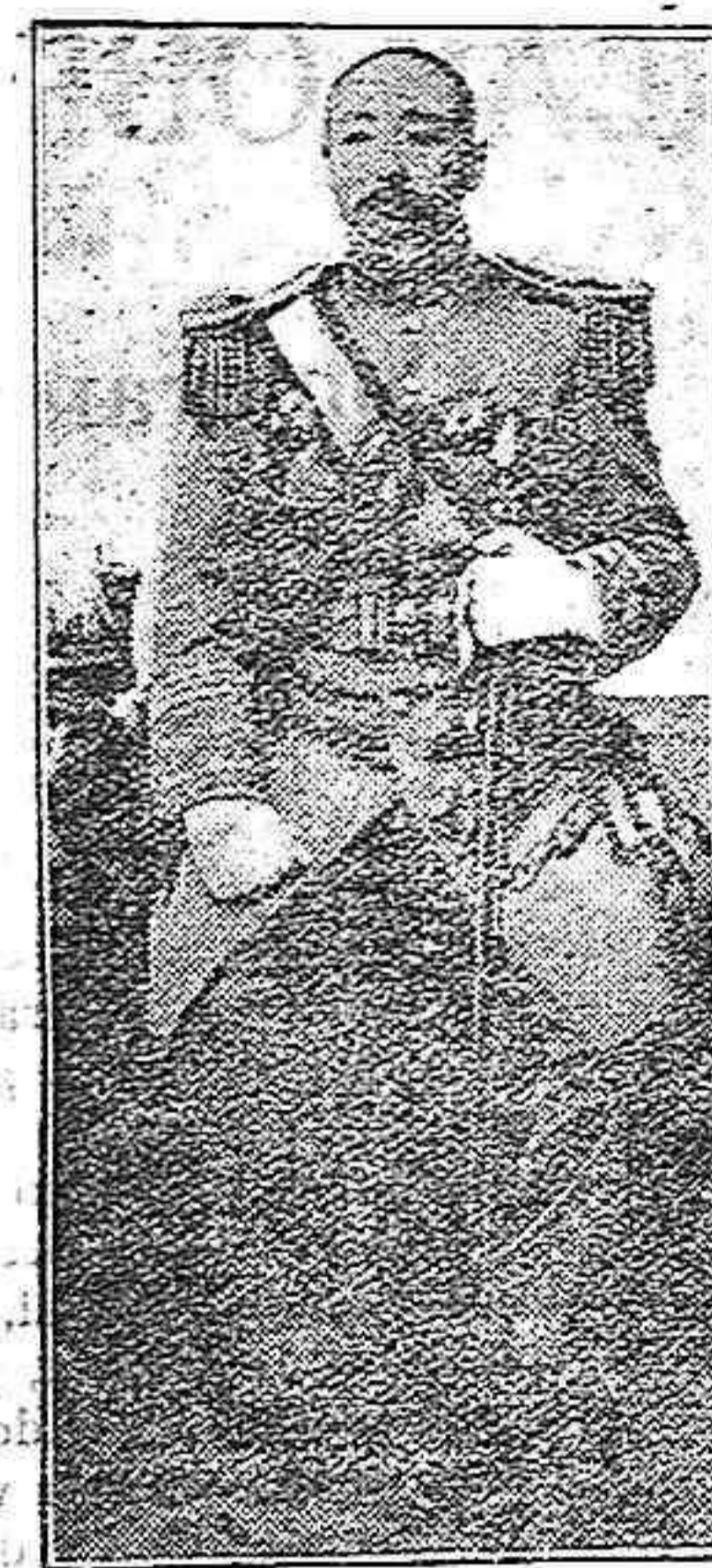
El mariscal chino, Chang-Su Lin, que ha sido víctima de un atentado