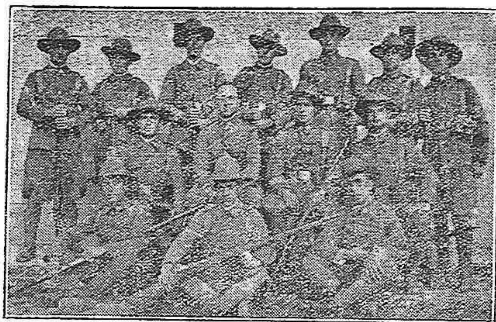
Grupo de tiradores de la patrulla del regimiento de Infantería de Gravelinas, núm. 41.

—Sinceramente creo que todos son buenos, y lo más apreciable es, que individuos que en un principio no cubrían en tiradas individuales, y con toda calma el cincuenta por ciento, hayan llegado en pruebas de velocidad a rebasar el noventa. Conceptúo de