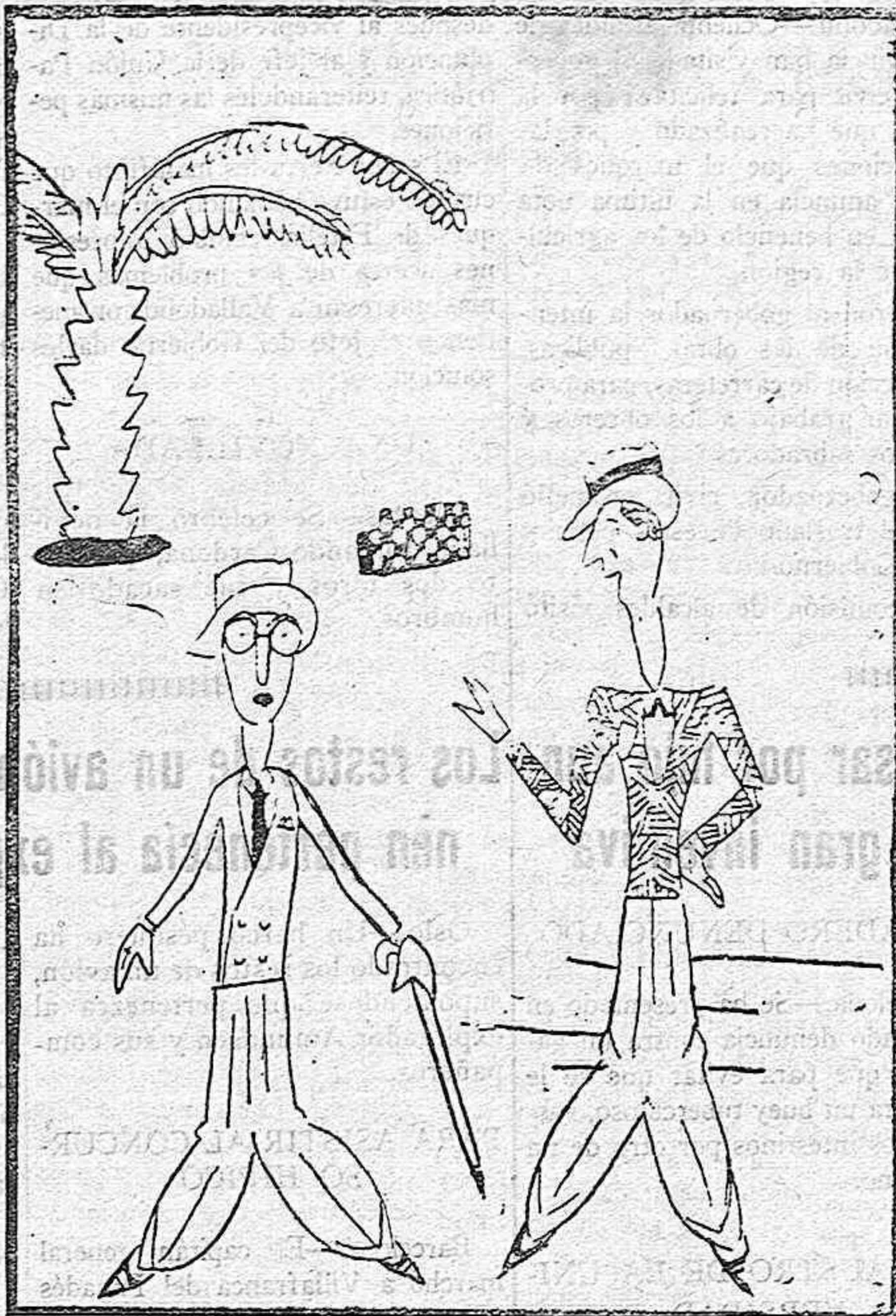
—Oye, Eufrosio: ¿tú que opinas del pacto Kellogg? —"Ke... yo" no entiendo de esas cosas.