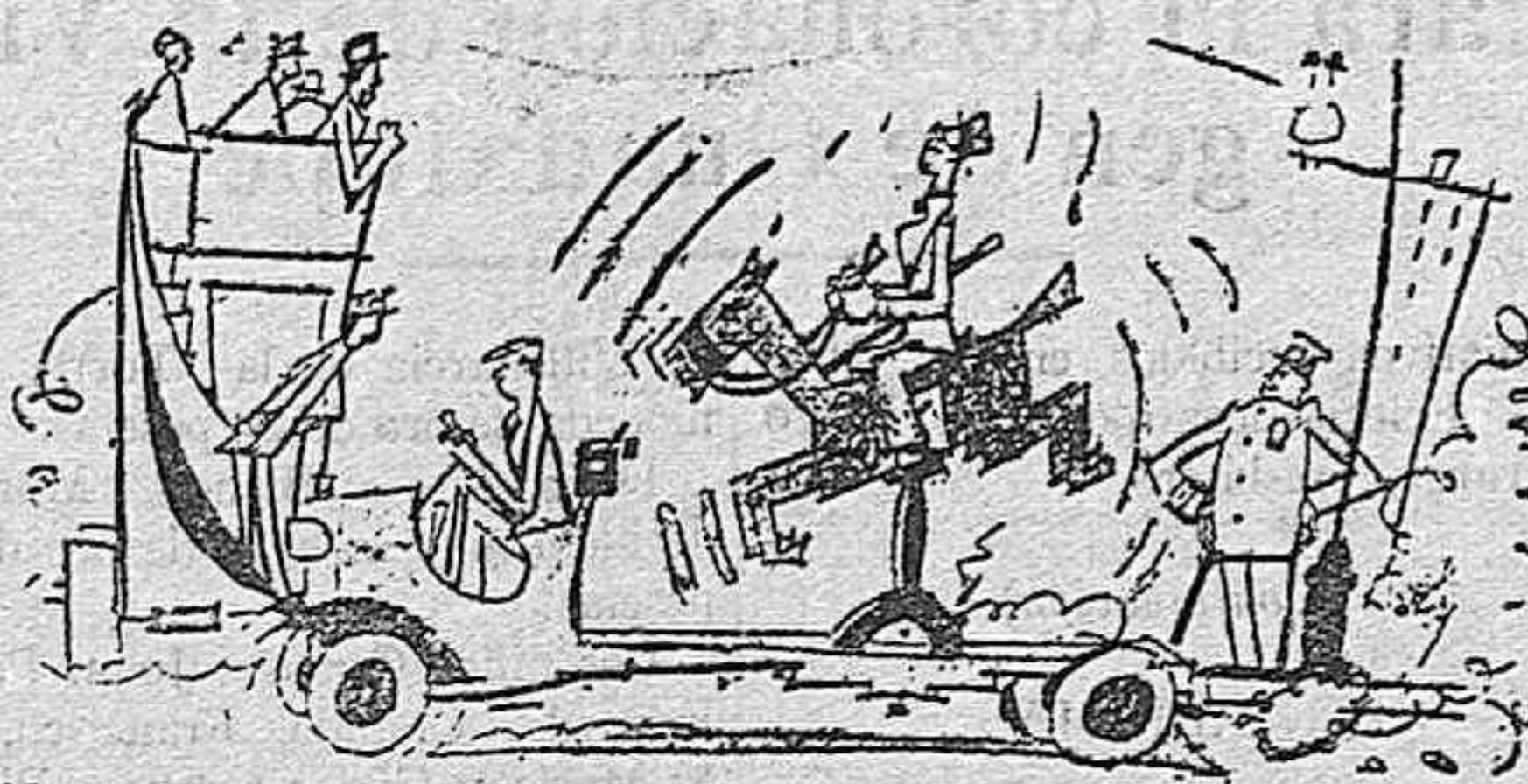
No todos podemos tener caballos eléctricos ni tiempo para ejercicios, así pues el taxis ecuestre nos suministra, además de locomoción, recreo y ejercicio.