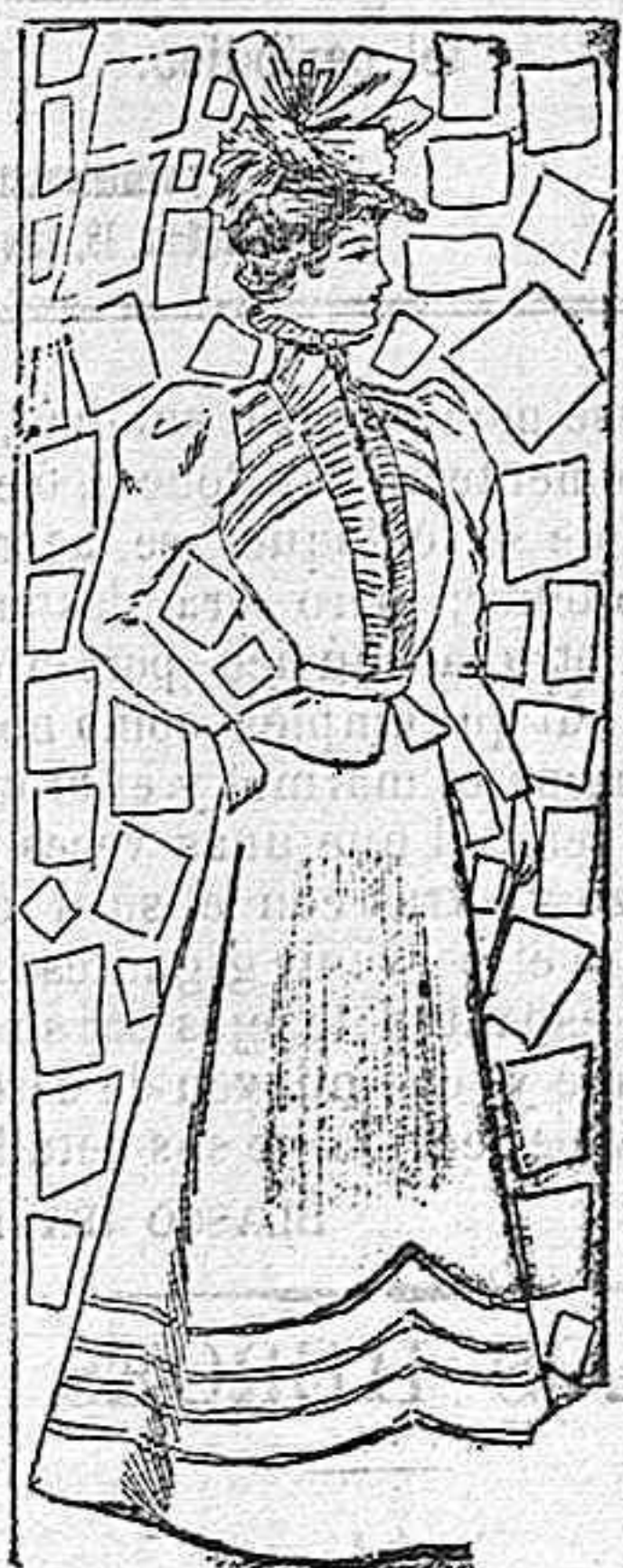
Trajes para playa.

Modelos exclusivos para nuestras lectoras, de los grandes almacenes de EL SIGLO, Barcelona (1).