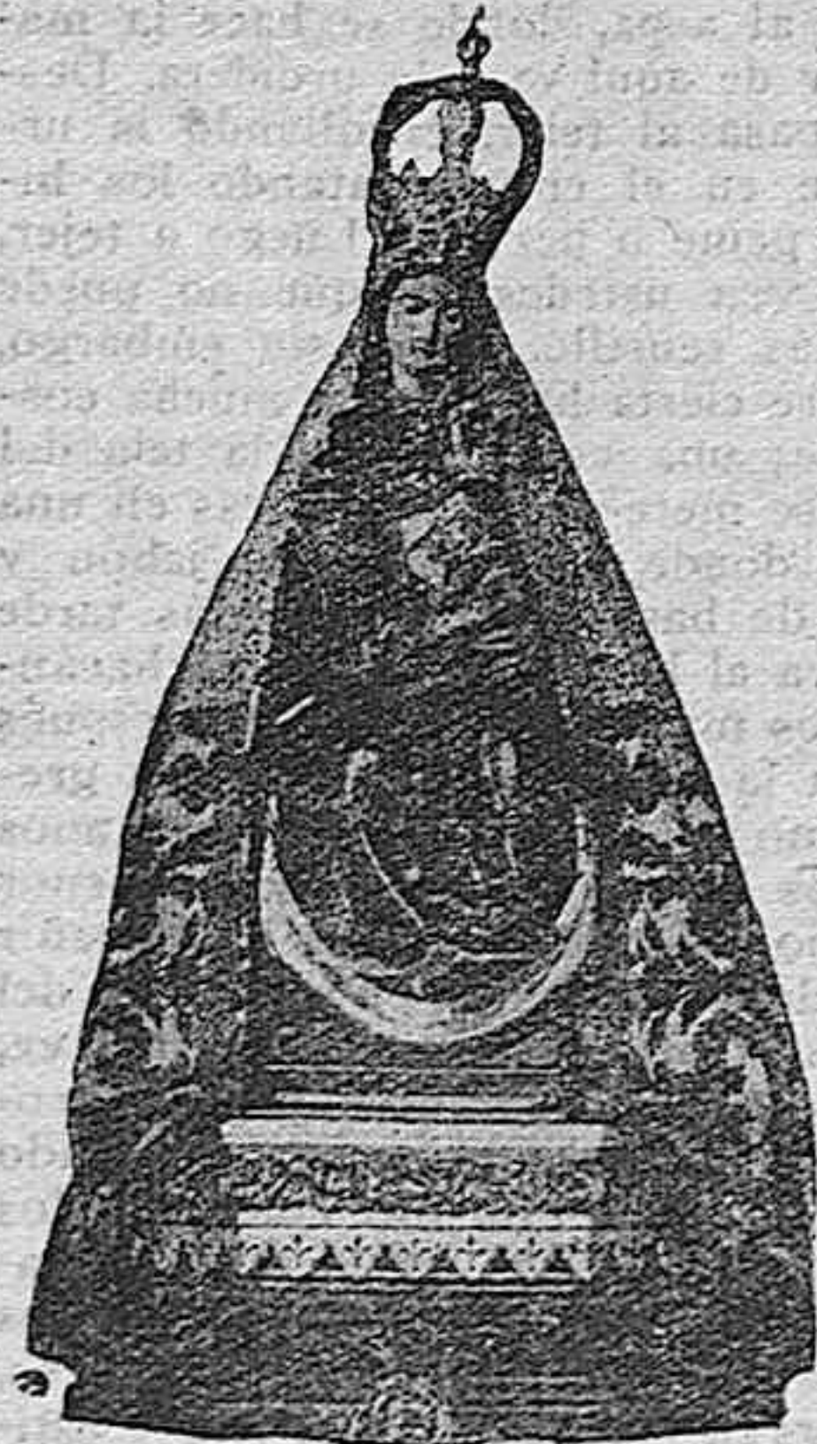
Nuestra Señora la Virgen de Belén

No se os suba la autoridad. Mañana podéis “no ser”. ¿Qué pasará entonces?