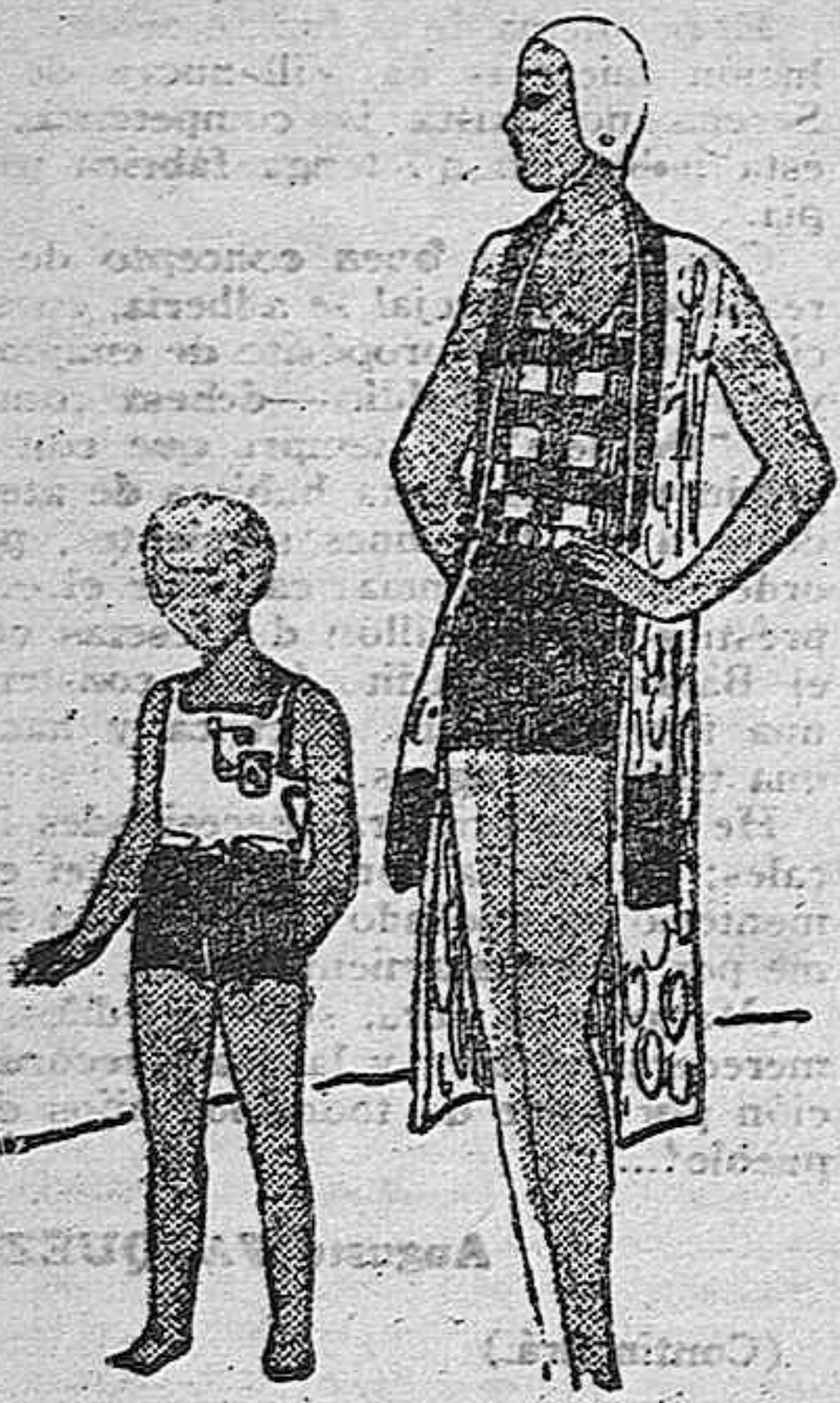
Los modernos trajes de baño