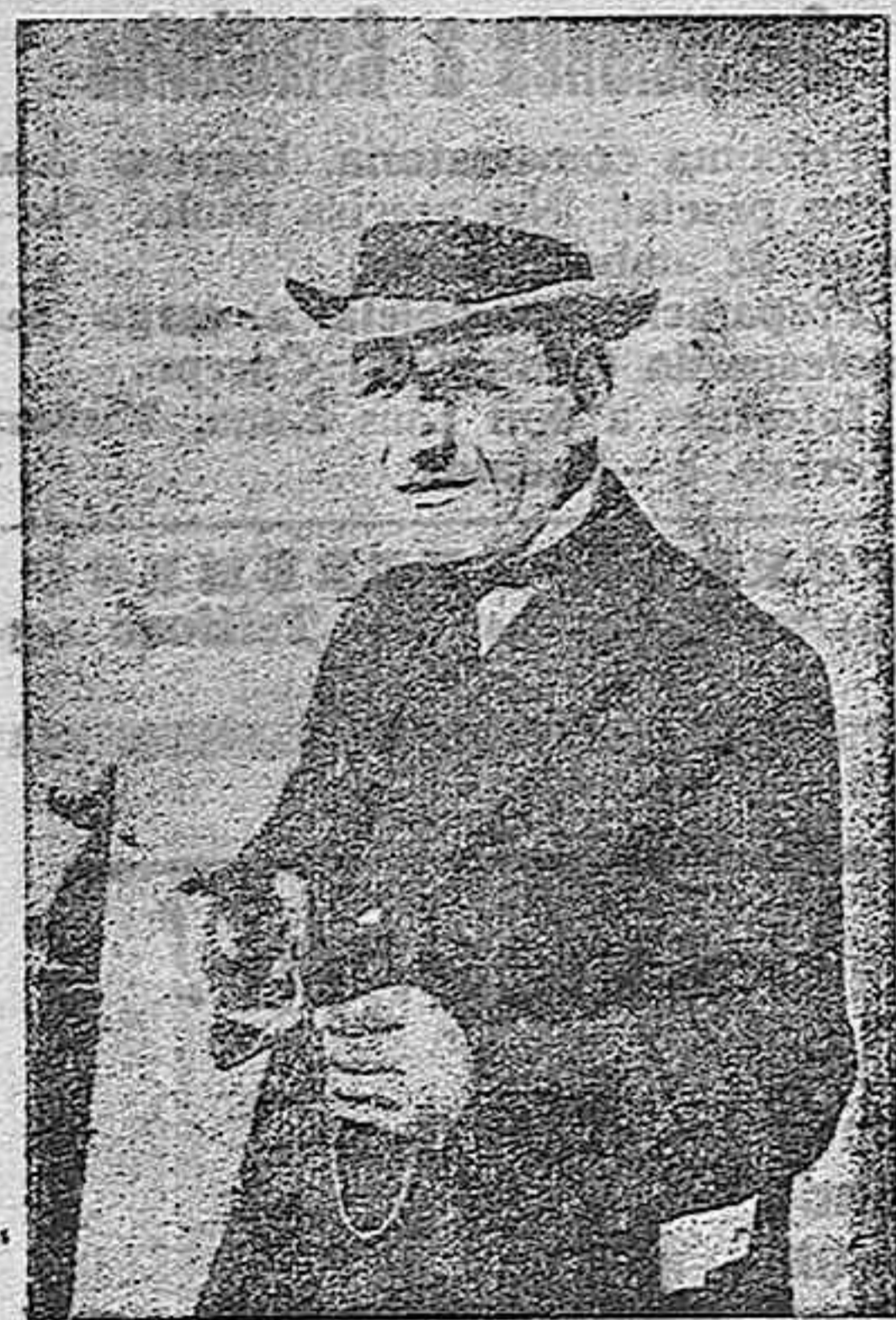
Formidable caracterización de Lon Chaney en "Cuando la ciudad duerme"

radas caracterizaciones ya no volverá a estremecerlos desde la pantalla con