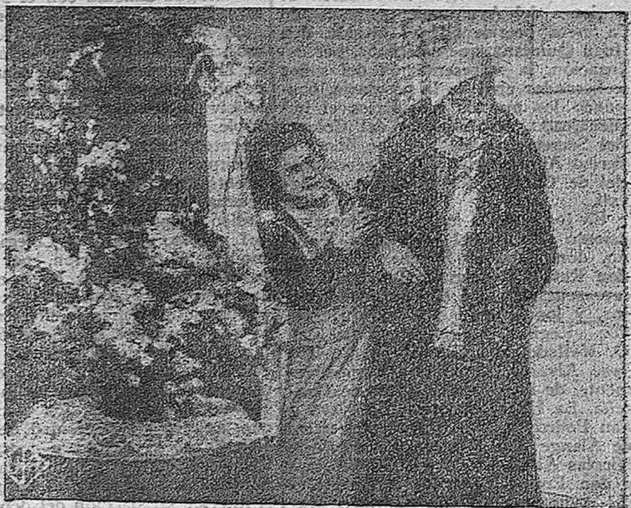
La exquisita estrella francesa Arlette Marchal en una escena interesante de "Máscara de mujer", película de la "UFA"