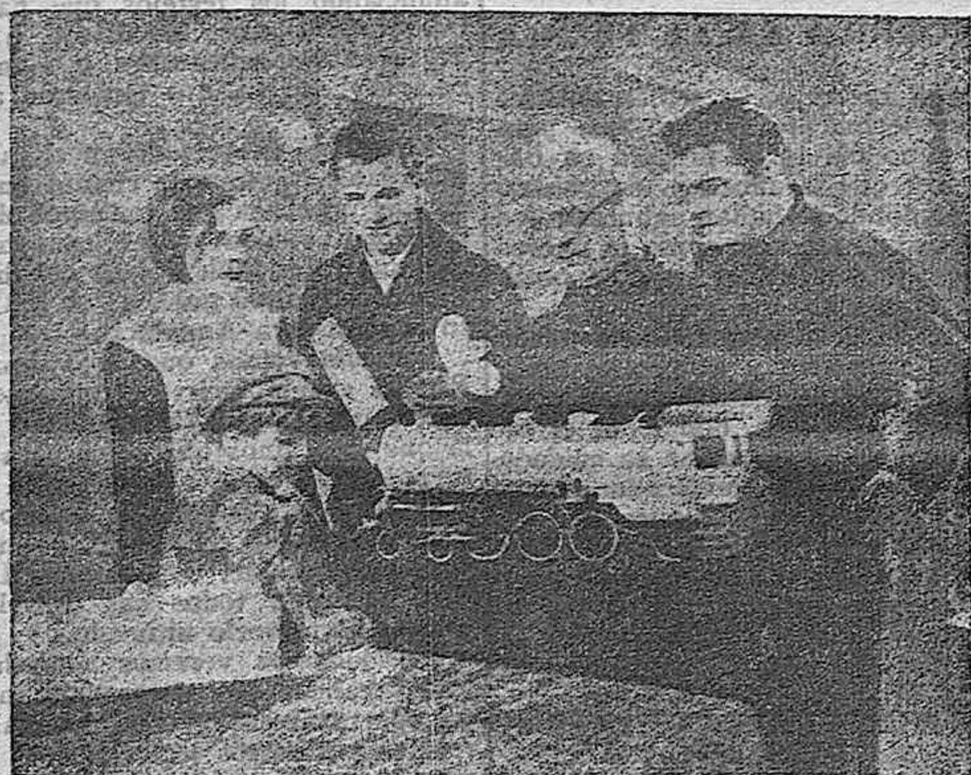
Un momento lleno de emoción de "Hombres de hierro"

En el mundo del arte luminoso y en las apoteosis fervientes de sus admiradores, se llamó LON CHANEY. En Colorado Spring, lugar de su nacimiento, en la cordialidad de su círculo de amistades, en el alma de una mujer, era HARRY CAMPHELL.