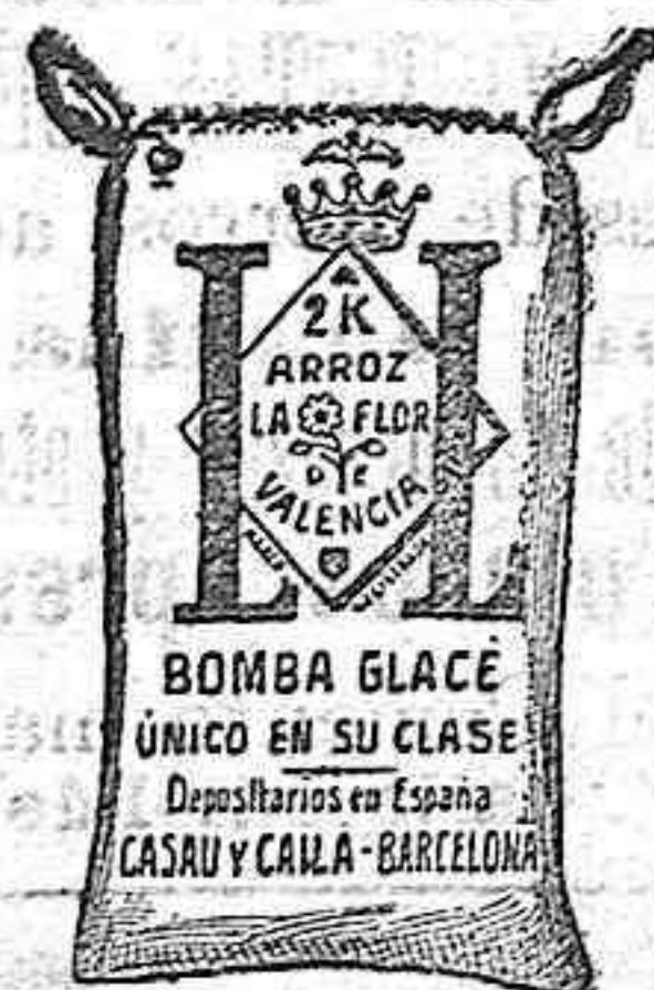
Arroz Glacé (2 Kilos)