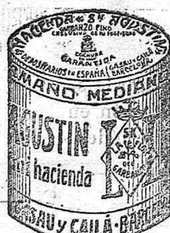
Garbanzo Sauco (5 Kilos)

Garantizamos al público que los comestibles empaquetados con nuestra marca son naturales de la planta, y sin contener la más pequeña adulteración en beneficio de ellos ni para hermostrarlos, por lo cual nos hacemos responsables á todo análisis que quiera efectuarse.