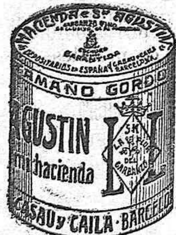
Garbanzo Sauco (5 Kilos)

Bastan tres fricciones para hacerla desaparecer por completo. Exito garantizado. No huele, ni mancha. Eficaz en toda clase de granos Pesetas 1'50 y 2 por correo.—Depósito: En Costuera en casa del autor A. Camacho.—Badajoz, Navarro, De Gabriel, 4.—Mérida: A. Rubio.—Madrid, Martín y Durán.