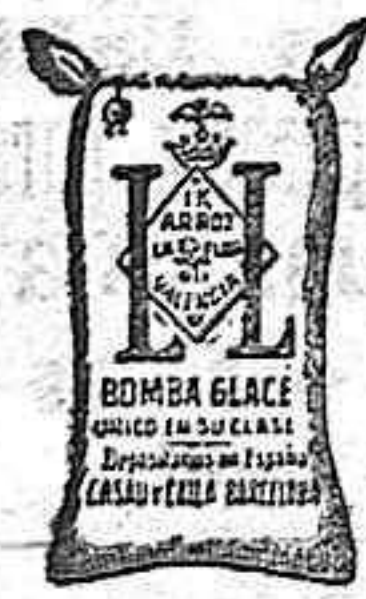
Arroz Glacé (1 Kilo)