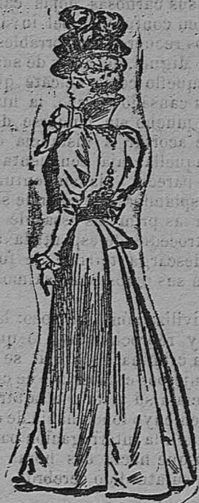
Traje para visita.

Modelos exclusivos para nuestras lectoras, de los grandes almacenes de EL SIGLO, Barcelona (1).