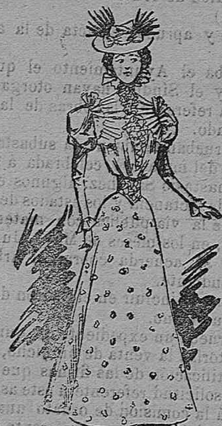
Traje para campo.

Modelos exclusivos para nuestras lectoras, de los grandes almacenes de EL SIGLO, Barcelona (I).