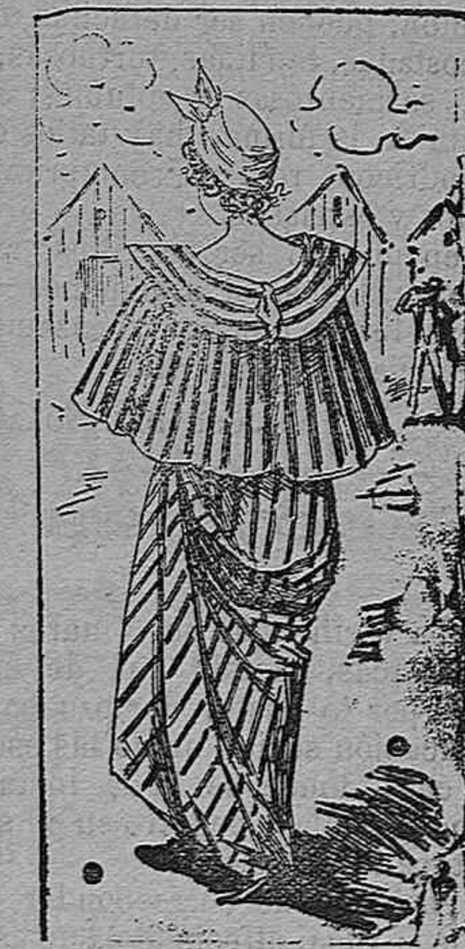
Capa para salir del baño.

Blusa larga y escotada, de franela blanca, con tres rulos de lana azul marino alrededor del escote; corpiño, también azul marino, con ojete y cordón; manga con dos volantes, y falda arrugada con dos rulos en el borde.