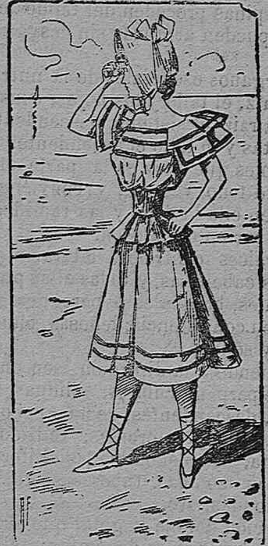
Traje para baño.

Modelos exclusivos para nuestras lectoras, de los grandes almacenes de EL SIGLO, Barcelona (1).