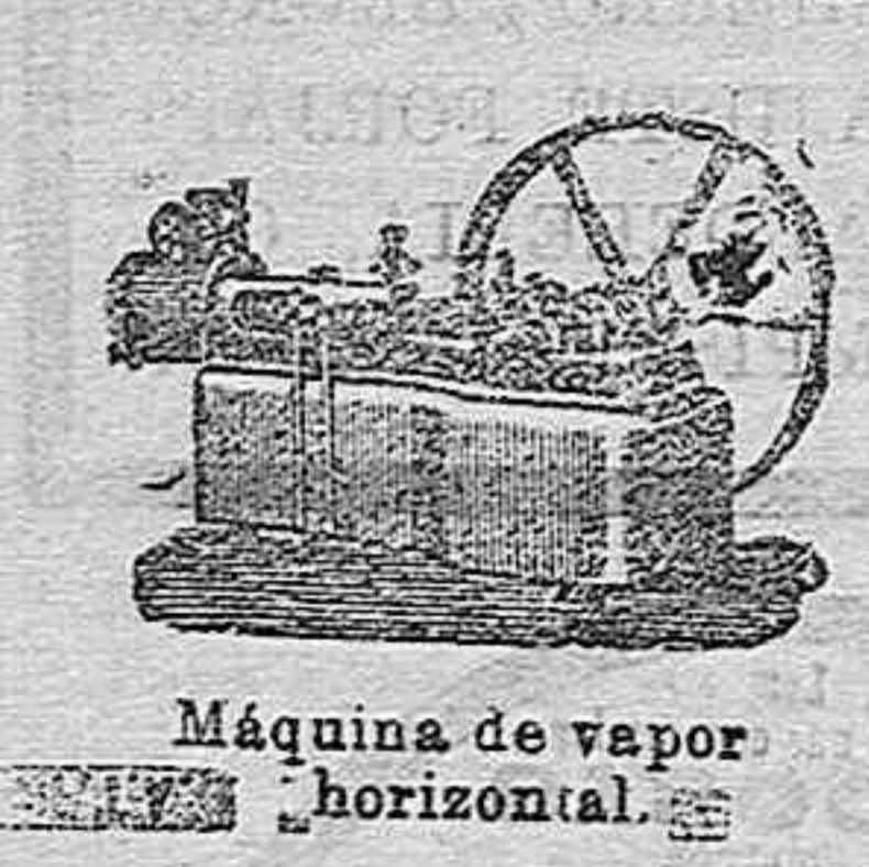
Máquina de vapor horizontal.

DESPACHO: Alcalá, 52. DEPÓSITO: Claudio Coello, 53 SUCURRAL: Campo Grande, Letra E. Valladolid. Madrid.