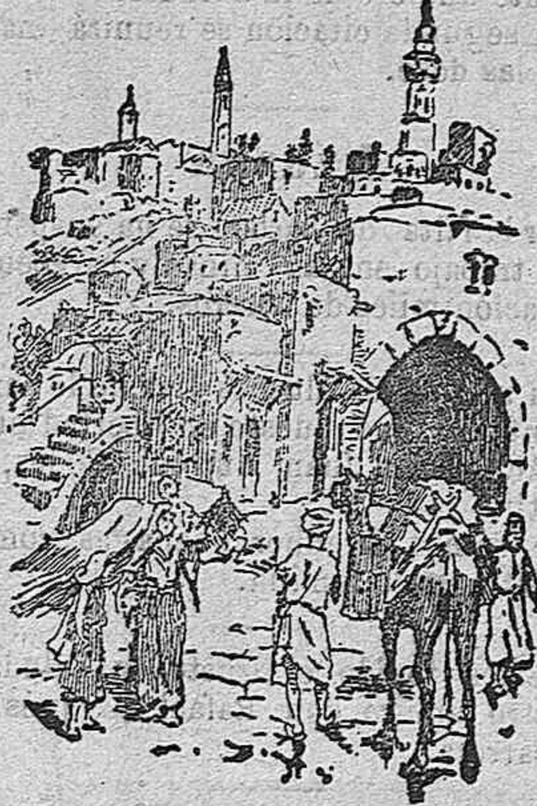
Entrada de Belén

Las limosnas que voluntariamente dejan los viajeros, y los que os recogen anualmente el día de Navidad en todas las iglesias del orbe cristiano, bastan para realizar este admirable ejemplo de hospitalidad y tolerancia.