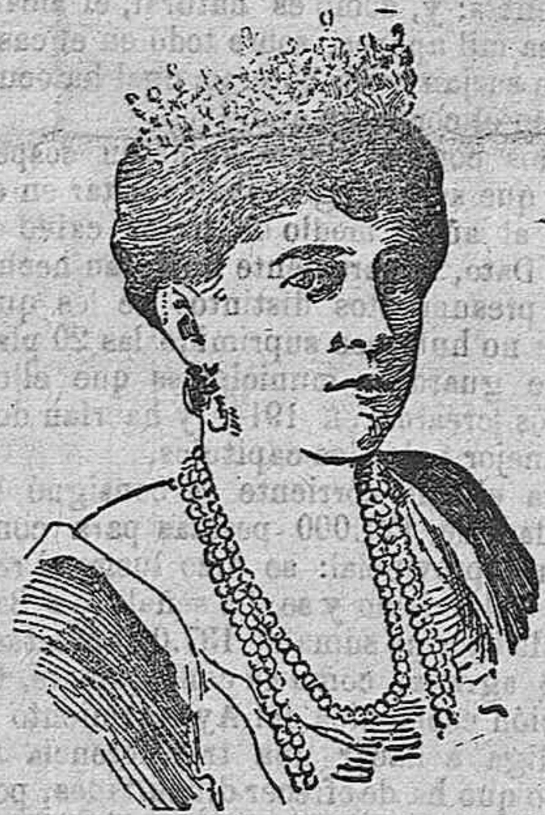
SOFÍA, ex reina de Grecia.