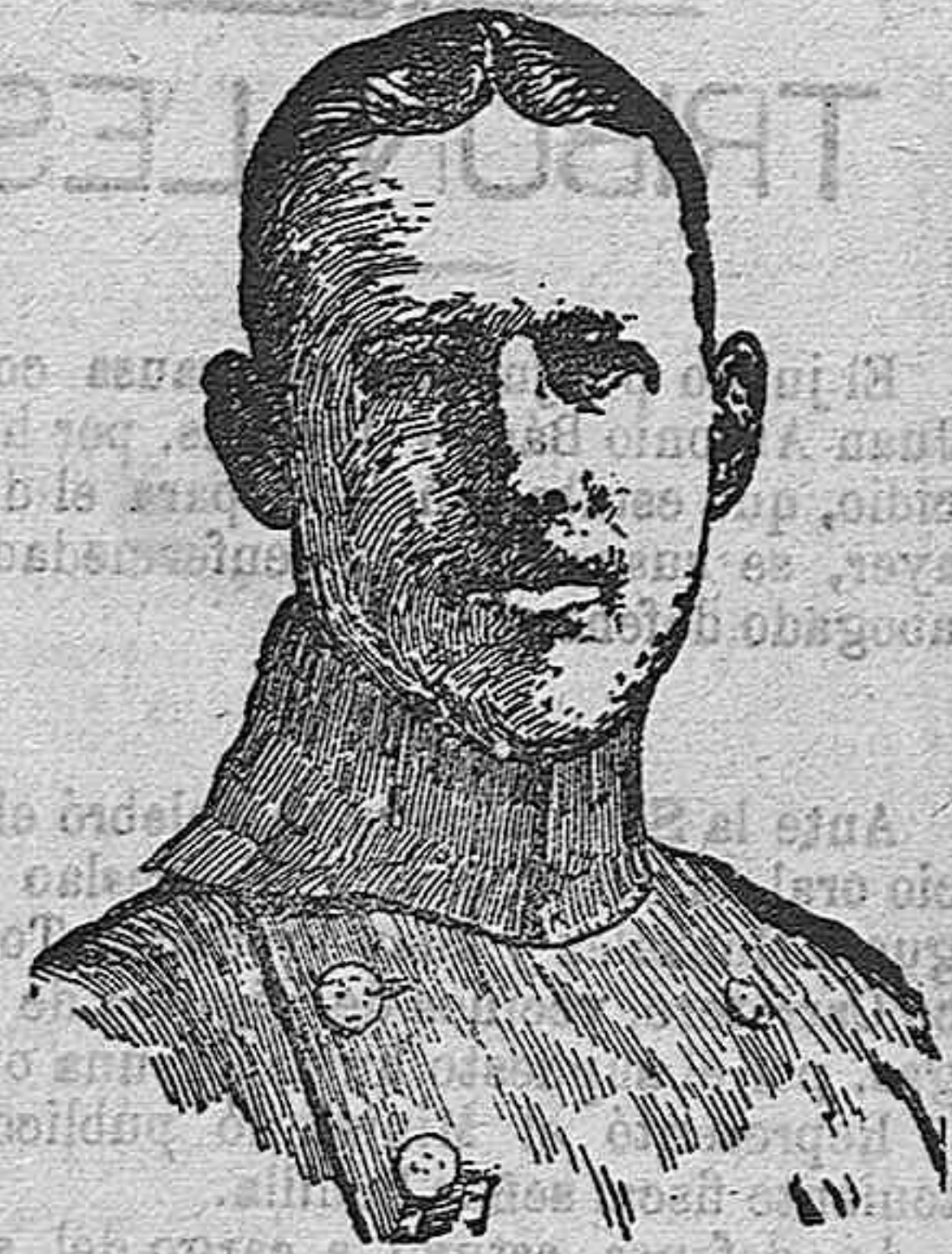
EL PRINCIPE ALEJANDRO en quien su padre el rey Constantino, ha abdicado la corona de Grecia

El dualismo entre el monarca y Venizelos trajo consigo la división del país, la constitución de un Gobierno provisional, al que obedecía una parte importante de la nación, y una situación política e internacional cada vez más difícil y complicada. Las fuerzas aliadas bajo la égida de Venizelos ocuparon Salónica, imaginando que al entrar Bulgaria en la liza, Grecia cumpliría el tratado que la ligaba con Serbia; pero el rey rehusó cumplirlo. Las relaciones del monarca y de sus consejeros con las potencias aliadas, ya muy ásperas entonces, han ofrecido desde entonces episodios de extraordinaria gravedad. Los aliados, temerosos de traición, por parte del rey, demandaron garantías que fué preciso otorgar, no obstante su carácter depresivo para un país libre. Esta situación no podía prolongarse mucho tiempo, sin que un cambio profundo abriese el camino a una solución. El rey se ha decidido a abandonar el trono, abdicándolo en su hijo, el príncipe Alejandro. ¿Se restablecerá bajo el nuevo monarca la unidad de Grecia? ¿Sobre qué bases? ¿Qué modificaciones va a aportar este cambio a las relaciones entre Grecia y los aliados?