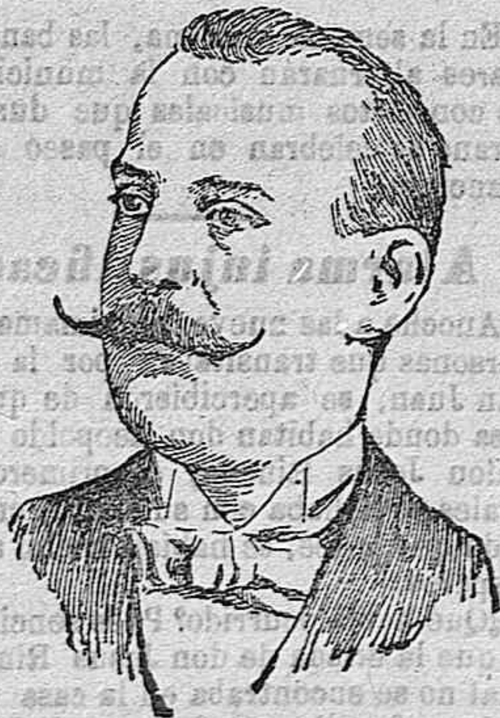
EL EX REY CONSTANTINO DE GRECIA

El rey Constantino ha tenido al fin que abdicar la corona. Pocos monarcas habrán atravesado una situación más difícil y más peligrosa que la que ha soportado el rey de Grecia desde el comienzo de la guerra. Las tradiciones, los recuerdos históricos y los lazos de gratitud debían colocar a Grecia al lado de las potencias que forjaron la independencia de la nación helénica y que dieron el trono al padre del propio Constantino; tal era el pensamiento de Venizelos, quien añadía a las consideraciones históricas y sentimentales, otras derivadas de los intereses nacionales de Grecia, que no podían menos de ser afectuosos por los triunfos sobre los enemigos históricos, Turquía y Bulgaria. Pero el rey, tal vez cediendo a influencias de familia—ya se sabe que está casado con una hermana del emperador Guillermo—deseaba mantener a Grecia en la neutralidad.