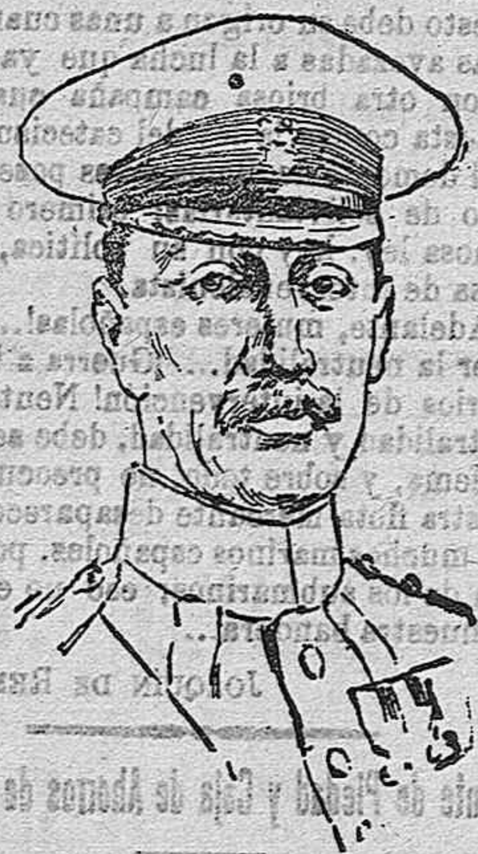
Mayor general Infneville-Williams, comandante del ejército británico, que opera en el sector del Ancre