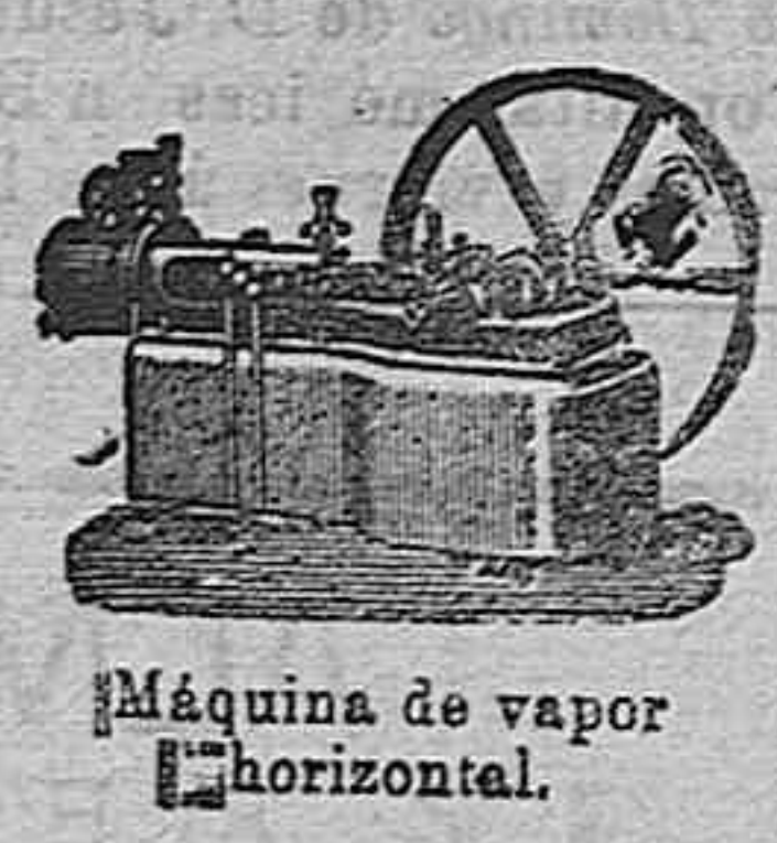
Máquina de vapor horizontal.