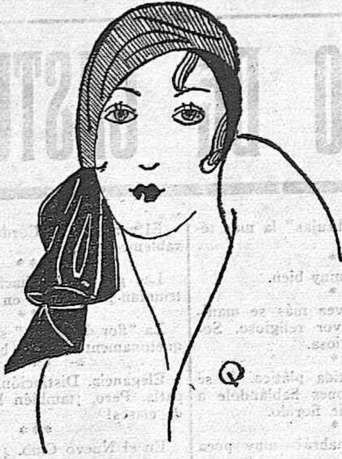
Toquita de seda, con gran lazo, muy original