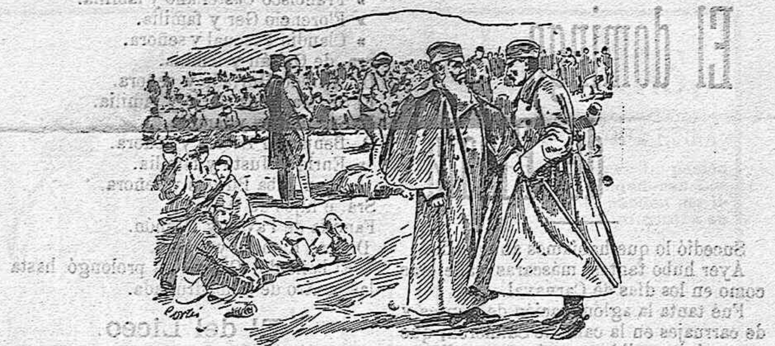
Cuadro del conflicto balkánico Campamento en las líneas de Chataldja

Y hay que leer el magnífico recibimiento hecho á tal señor! ¡Cuanta sun-