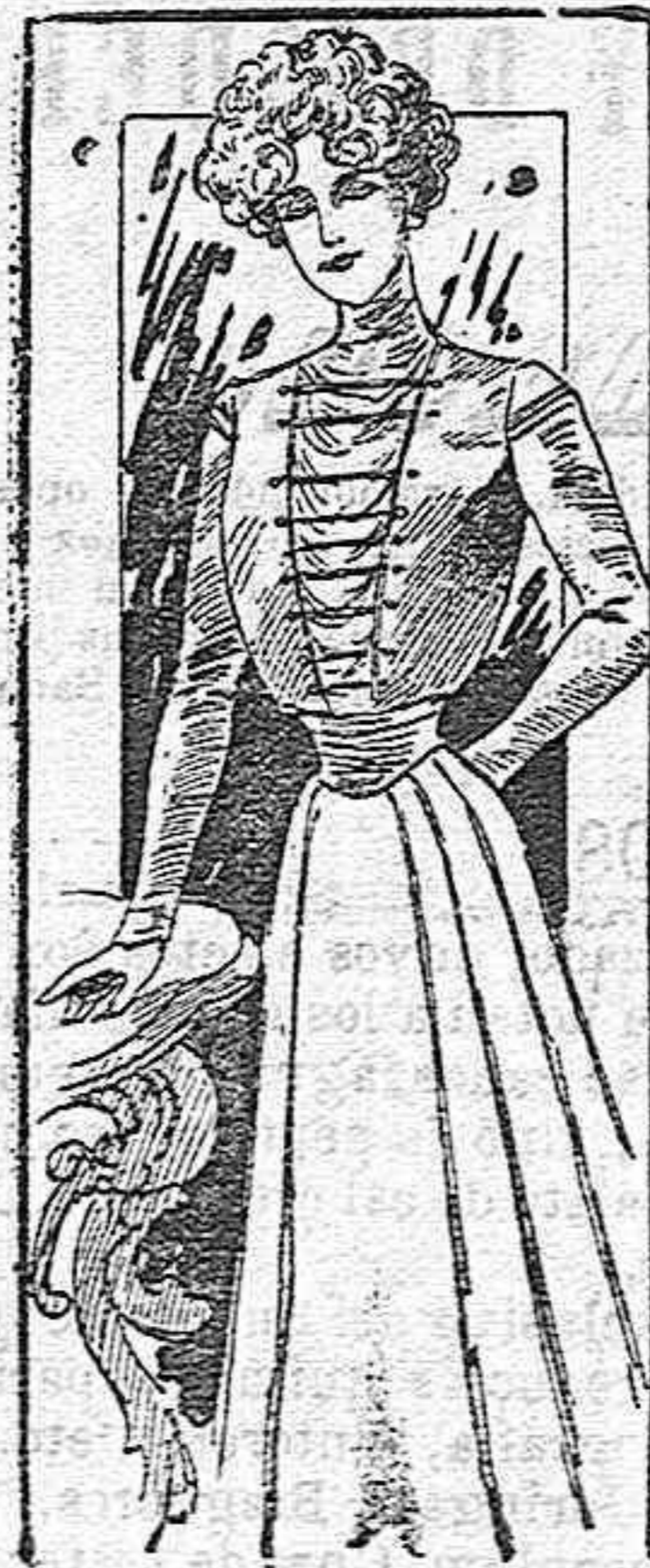
TRAJE PARA SEÑORITA.

Modelos exclusivos para nuestras lectoras de los Grandes almacenes de EL SIGLO, Barcelona