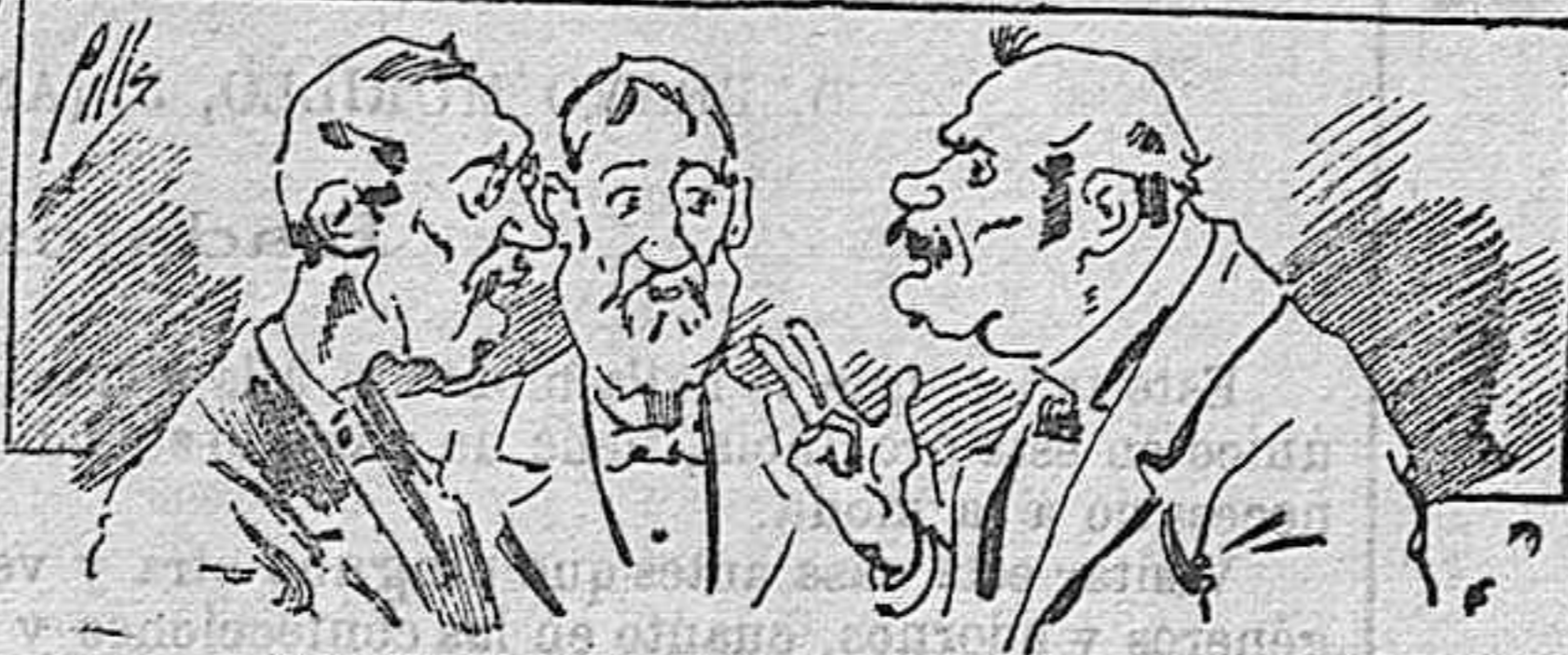
Abominan á nuestros libros..... pero los compran.

Todas las personas de gusto, curiosas é ilustradas deben pedir al Director de LA AVISPA, apartado núm. 8, MADRID, un ejemplar que se remite gratis y franqueado. Esta Revista Enciclopédica Popular publica recreaciones científicas, recetas de cocina, repostería, confitería, vinos, licores, pinturas, barnices, betunes y fórmulas para toda clase de industria, y cuantas noticias y conocimientos puedan ser beneficiosos. Cuenta además con buenos grabados, parte literaria excelente, da regalos mensuales á sus lectores con la Lotería Nacional y participaciones en la misma, á cuyo efecto compra todos los sorteos, y en una de las Administraciones más afortunadas por la suerte, billetes enteros. La suscripción y los números que se nos pidan se sirven gratuitamente á correo vuelto y franqueados, con sólo indicar el nombre y dirección del que lo desea en sobre dirigido al Sr. Administrador de