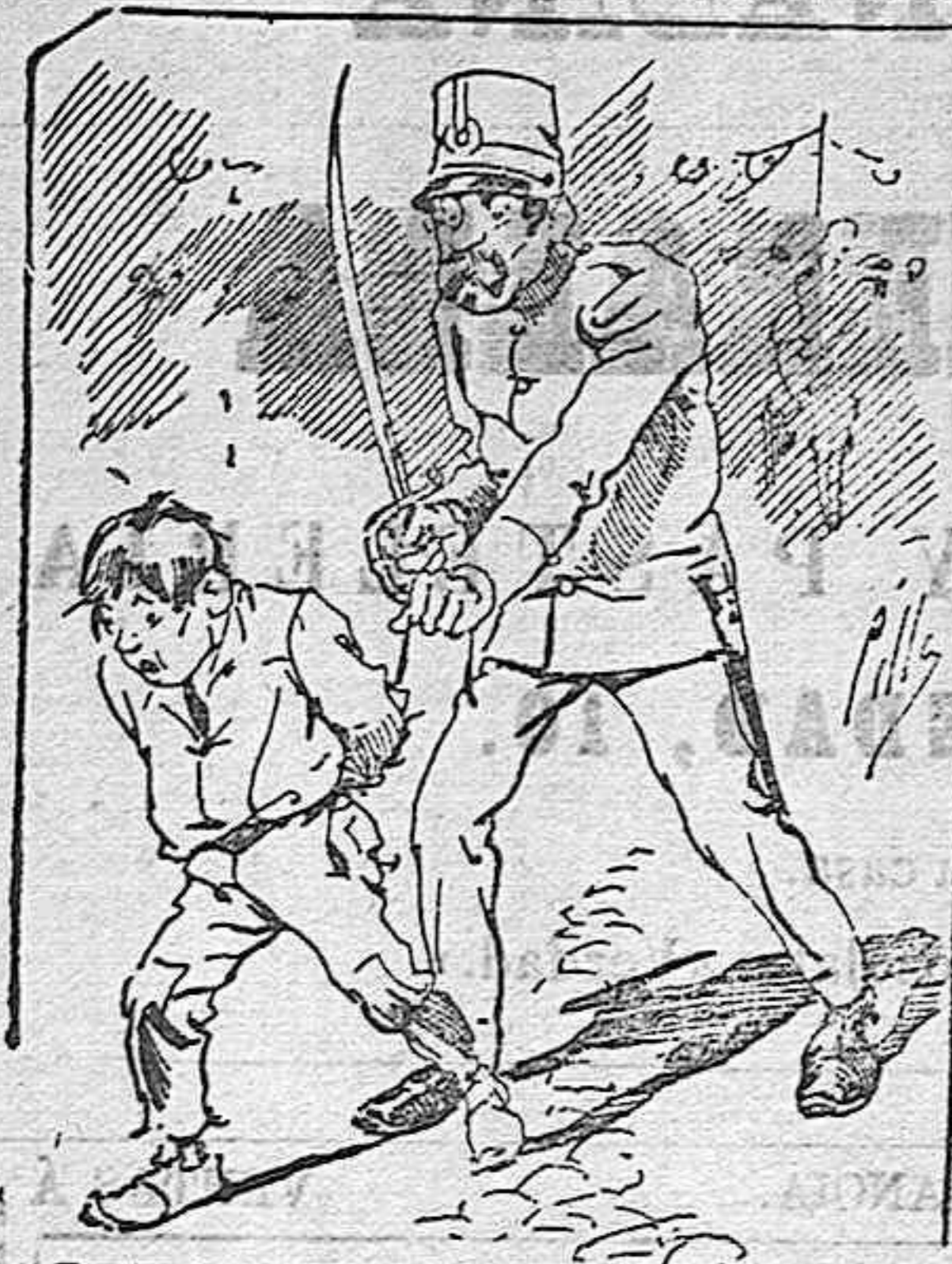
Tratamientos de la policía á nuestros vendedores cuando el número pica.....