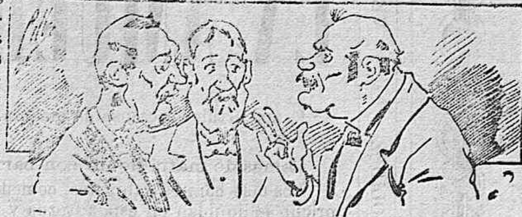
Abominan á nuestros libros..... pero los compran.

Todas las recetas de gusto, curiosas é ilustradas deben ser enviadas al Director de LA AVISPA, apartado núm. 8, L. 1111, en un ejemplar que se remite gratis y franqueado. Esta Revista Enciclopédica Popular publica recreaciones científicas, recetas de cocina, repostería, confitería, vinos, licores, pinturas, barnices, betunes y fórmulas para toda clase de industria, y cuantas noticias y conocimientos puedan ser beneficiosos. Cuenta además con buenos grabados, parte literaria excelente; da regalos mensuales á sus lectores con la Lotería Nacional y participaciones en la misma, á cuyo efecto compra todos los sorteos, y en una de las Administraciones más afortunadas por la suerte, billetes enteros. La suscripción y los números que se nos pidan se sirven gratuitamente á correo vuelto y franqueados, con sólo indicar el nombre y dirección del que lo desea en sobre dirigido al Sr. Administrador de