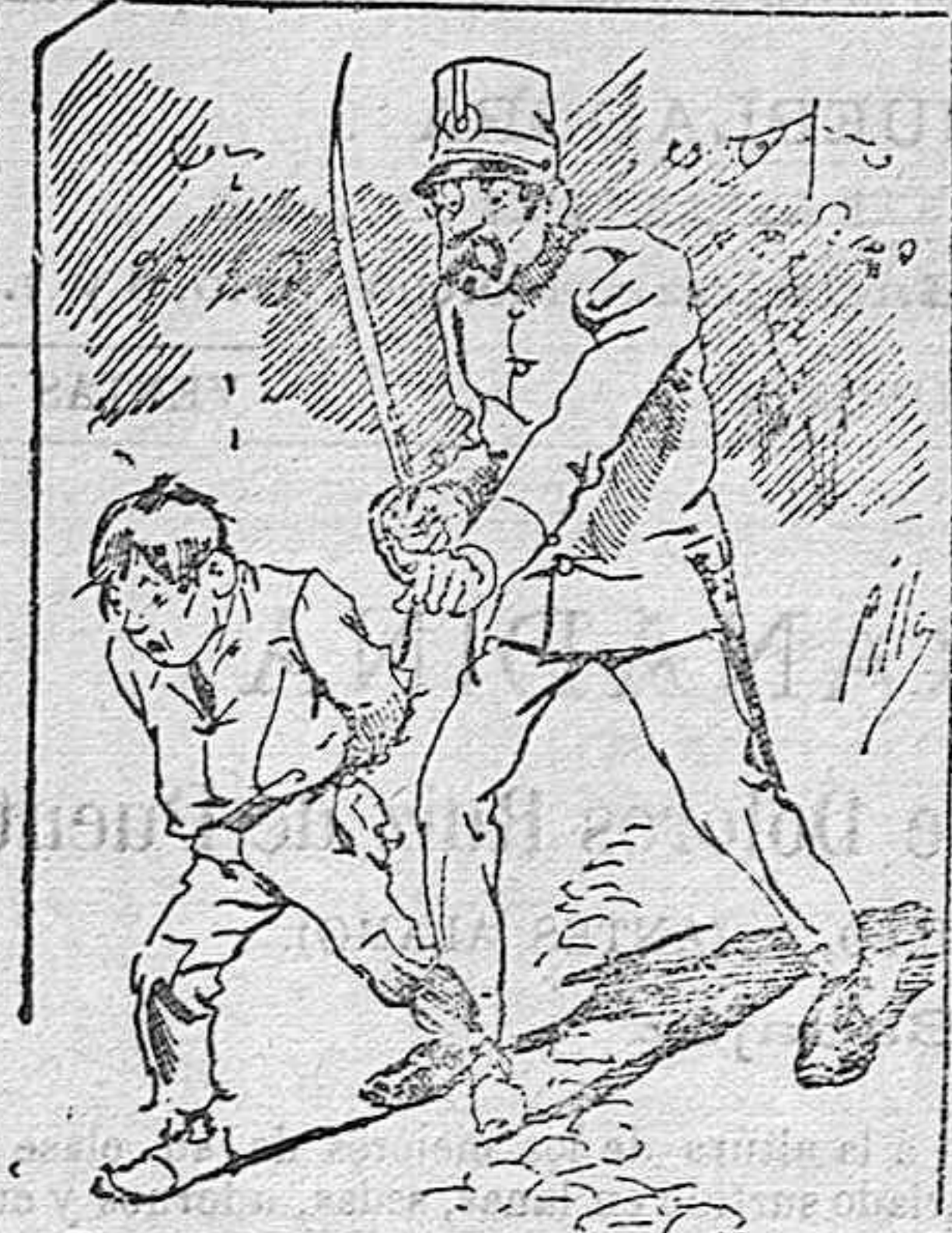
Tratamientos de la policía á nuestros vendedores cuando el número pica.....