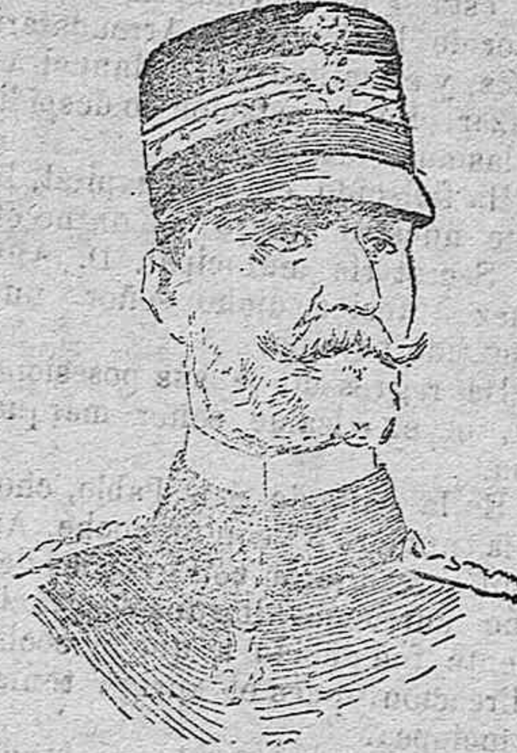
El general Dells Noce, antiguo comandante del octavo cuerpo de ejército italiano, en la actualidad marid uno de los rectores del Isonzo.