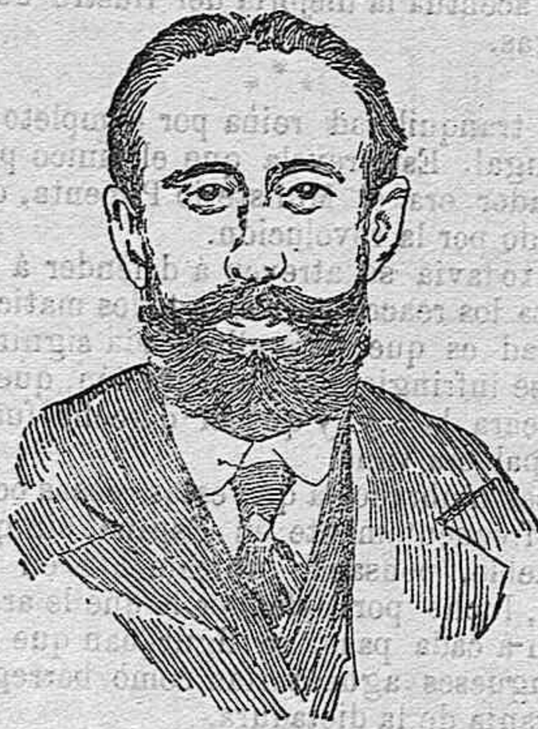
Maestro Conrado del Campo

No echaremos á vuelo las campanas del entusiasmo, porque en nuestro teatro Real haya modulado la orquesta, una vez más, poligonías netamente castizas españolas, algo inseguras todavía en determinados momentos, como que es muy difícil abstraerse á prejuicios é influencias de escuela; pero apuntamos el éxito de La tragedia del beso no solo como un triunfo personal para Conrado del Campo, sino como un paso firme hacia la existencia firme y vigorosa de la ópera española.