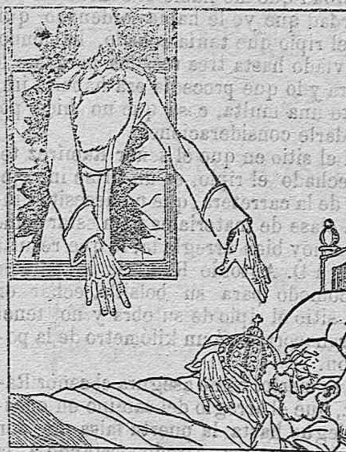
La pesadilla del emperador después de la rendición de Przemysl