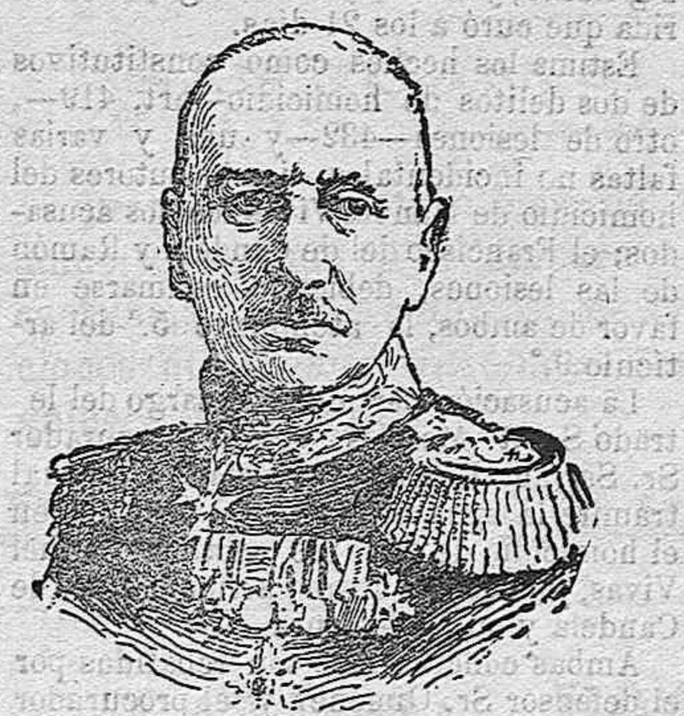
Von Kluck que manía el ejército alemán que ocupa el frente desde Verdun á la frontera suiza