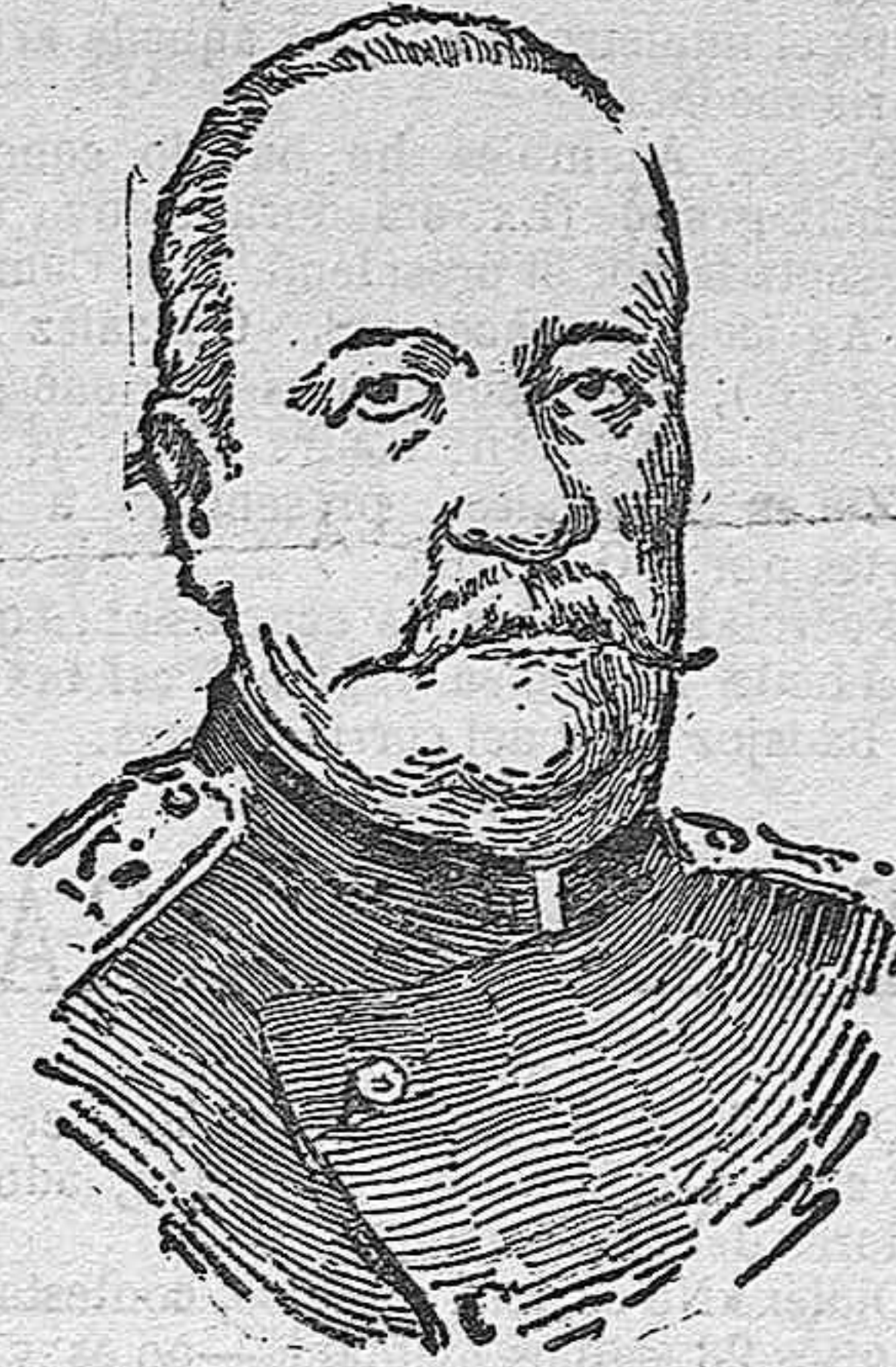
General conde Vorsutzow-Dachkrow, antiguo ministro del zar Alejandro III que después de vencer á los turcos en Sarykamyoch y Karaorgan, marcha al frente de su ejército sobre Erzerum, capital de Armenia