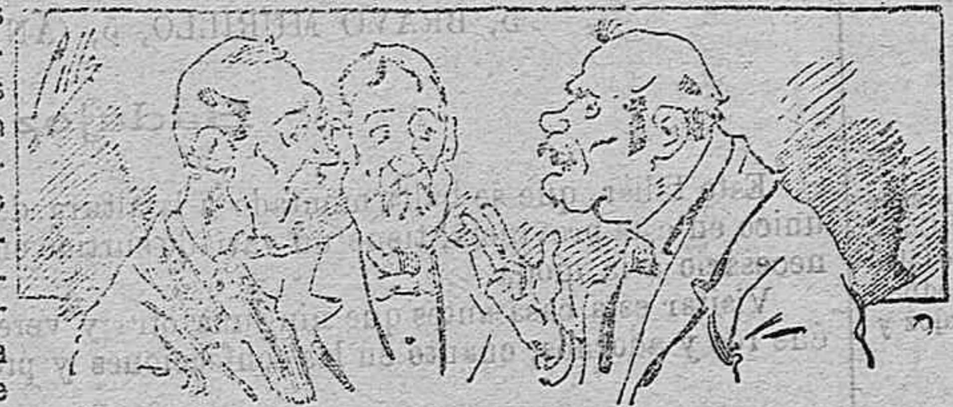
A honran á nuestros libros....., pero los compran.

Todas las personas de gusto, curiosas é ilustradas deben pedir al Director de LA AVISPA, apartado núm. 8, MADRID, un ejemplar que se remite gratis y franqueado. Esta Revista Enciclopédica Popular publica recreaciones científicas, recetas de cocina, repostería, confitería, vinos, licores, pinturas, barnices, betunes y fórmulas para toda clase de industria, y cuantas noticias y conocimientos puedan ser beneficiosos. Cuenta además con buenos grabados, parte literaria excelente; da regalos mensuales á sus lectores con la Lotería Nacional y participaciones en la misma, á cuyo efecto compra todos los sorteos, y en una de las Administraciones más afortunadas por la suerte, billetes enteros. La suscripción y los números que se nos pidan se sirven gratuitamente á correo vuelto y franqueados, con sólo indicar el nombre y dirección del que lo desea en sobre dirigido al Sr. Administrador de