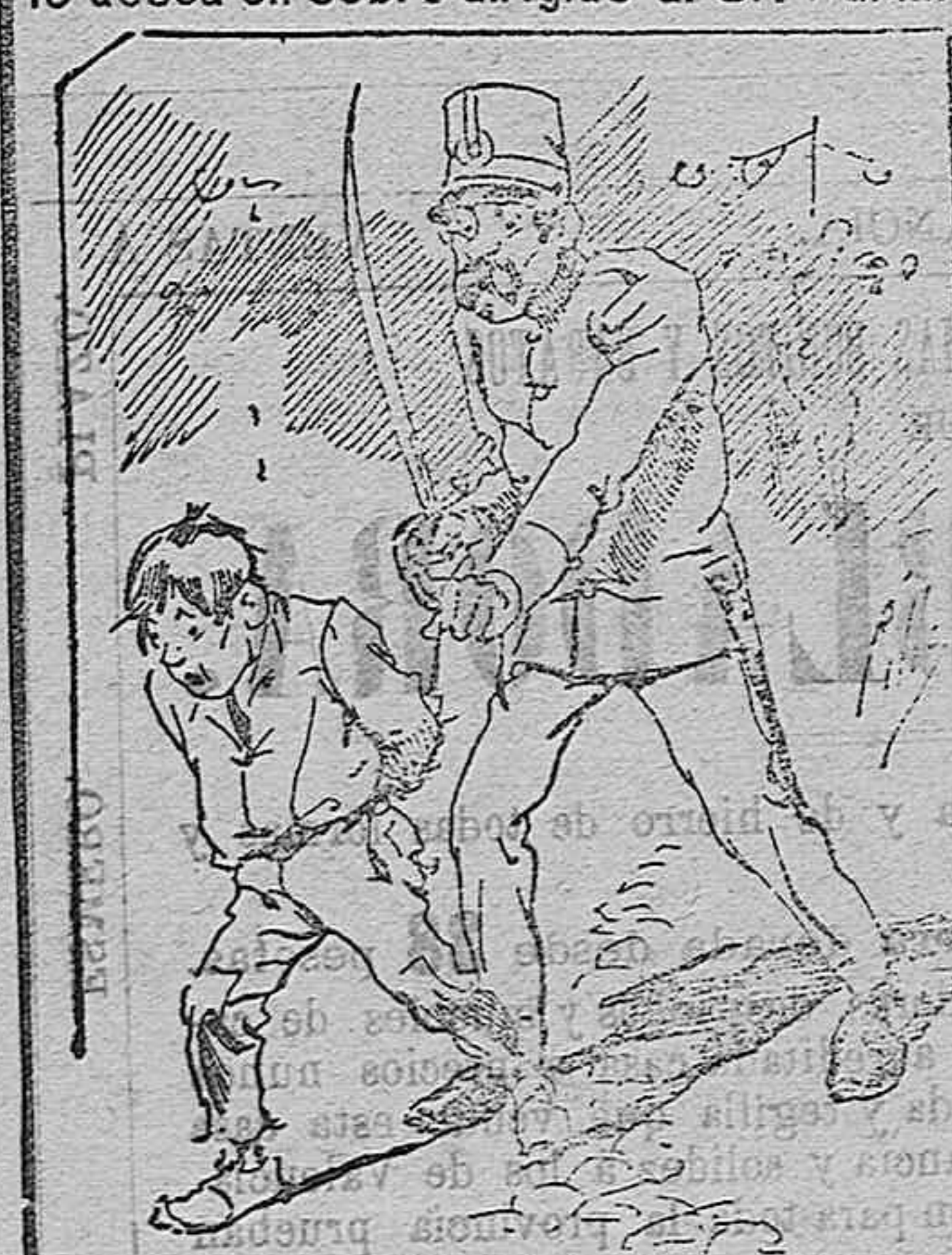
Tratamientos de la policía á nue tres vendedores cuando el número pica.....