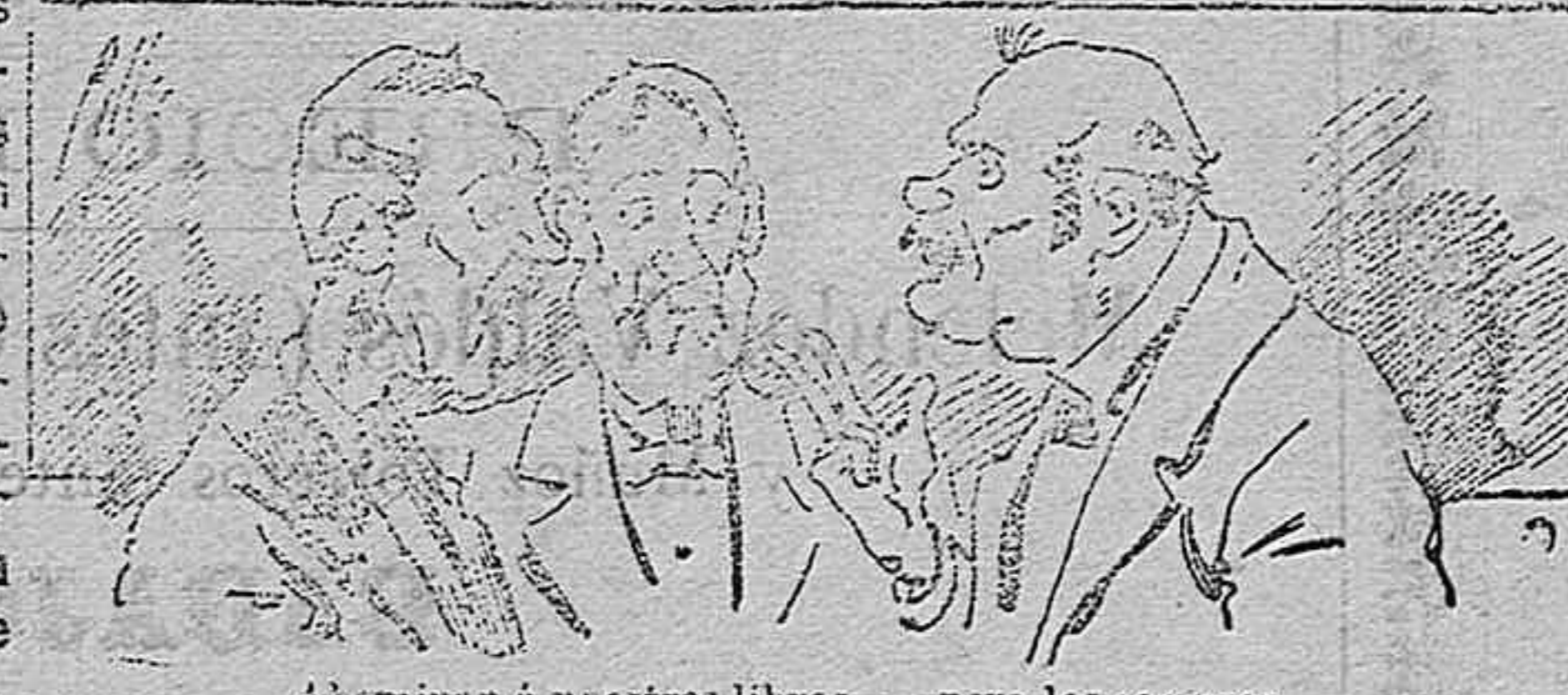
Aborrecen á nuestros libros..... pero los compran.

Todas las personas de gusto, curiosas é ilustradas deben pedir al Director de LA AVISPA, apartado núm. 8, MADRID, un ejemplar que se remita gratis y franqueado. Esta Revista Enciclopédica Popular publica recreaciones científicas, recetas de cocina, repostería, confitería, vinos, licores, pinturas, barnices, betunes y fórmulas para toda clase de industria, y cuantas noticias y conocimientos puedan ser beneficiosos. Cuenta además con buenos grabados, parte literaria excelente; da regalos mensuales á sus lectores con la Lotería Nacional y participaciones en la misma, á cuyo efecto compra todos los sorteos, y en una de las Administraciones más afortunadas por la suerte, billetes enteros. La suscripción y los números que se nos pidan se sirven gratuitamente á correo vuelto y franqueados, con sólo indicar el nombre y dirección del que lo desea en sobre dirigido al Sr. Administrador de