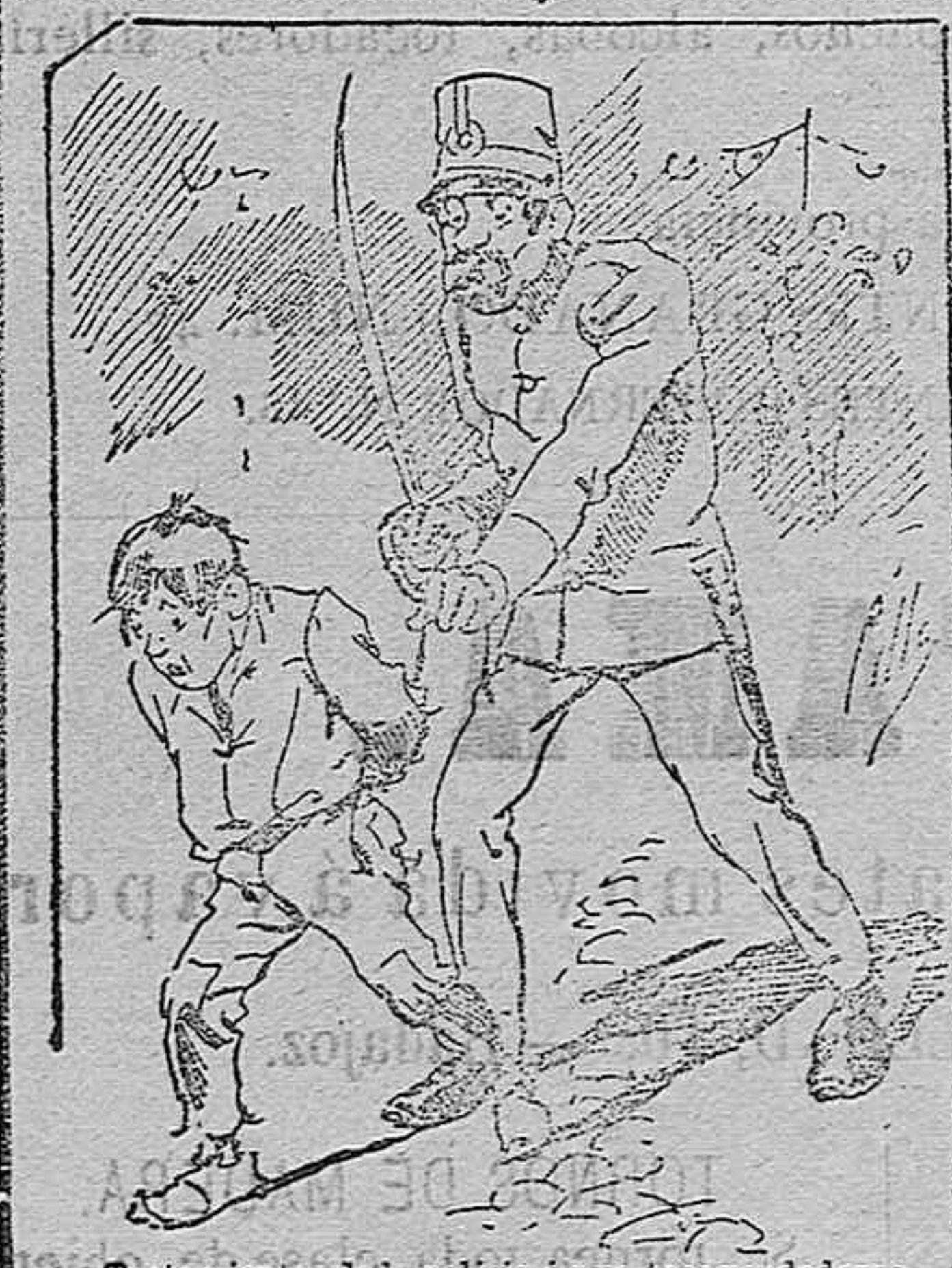
Tratamientos de la policía á rue tres vendedores cuando el número pica.....