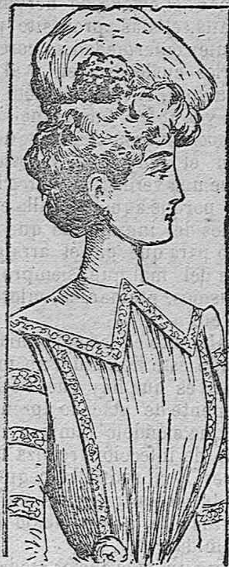
Toca para señorita.

Modelos exclusivos para nuestras lectoras, de los grandes almacenes de EL SIGLO, Barcelona.