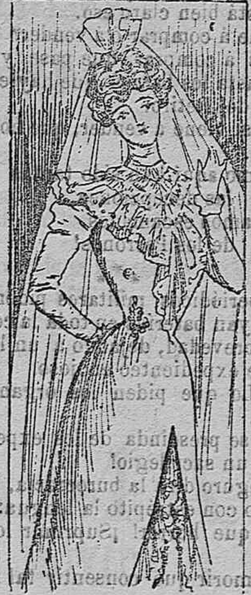
Traje para novia.

Modelos exclusivos para nuestras lectoras, de los grandes almacenes de EL SIGLO, Barcelona (1).