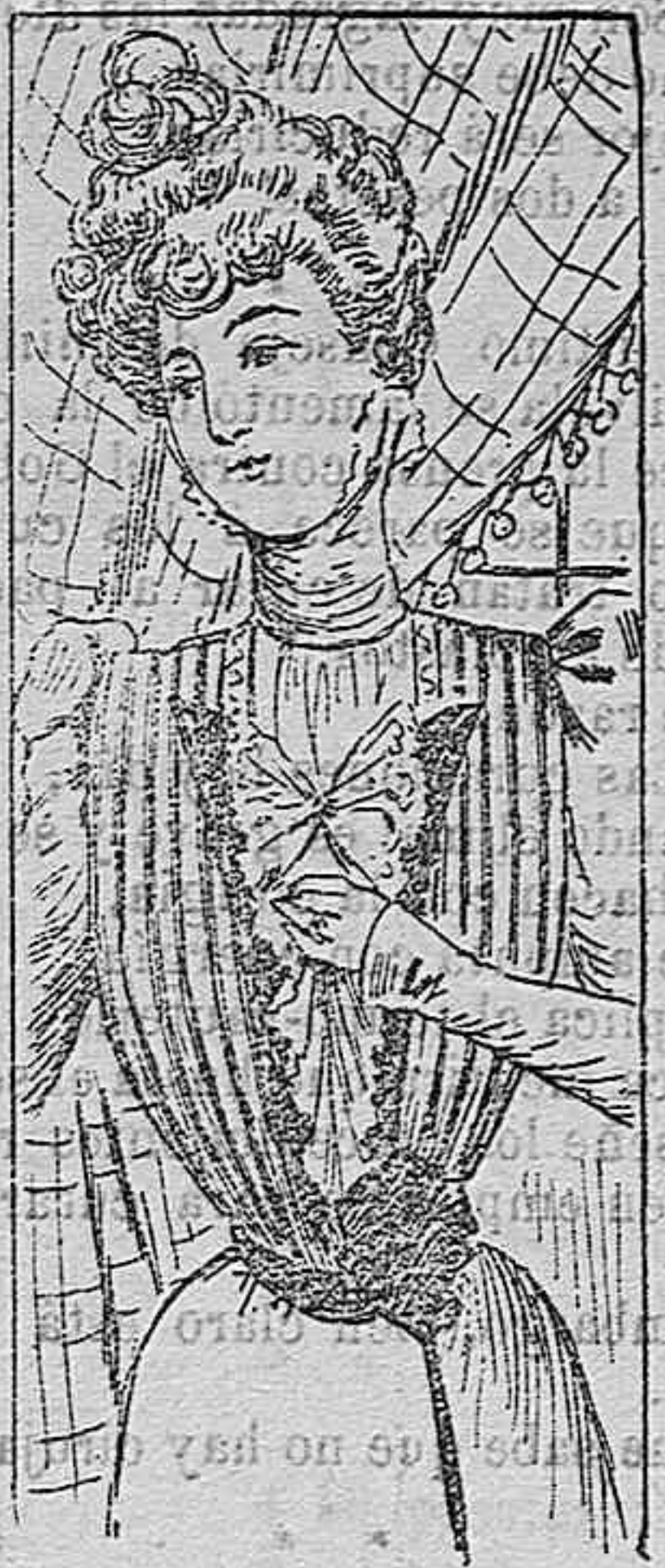
Blusa para señorita.

De raso blanco y forma princesa. Cuerpo adornado con gran fichu de encaje que cubre el pecho y termina en la cintura con una bonita caída de lo mismo. Cintas y flor de azahar al costado. Cuello recto con una cinta. Mangas ajustadas con encajes en los puños, y falda de gran cola abierta en el delantero y con un encaje que parte de esta abertura rodeando la cola de la falda.