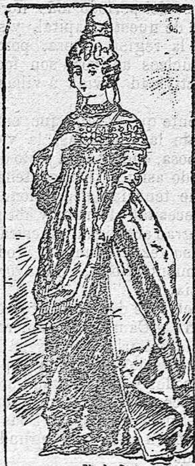
Traje de princesa alemana de principios del siglo XV.

Para este disfraz es condición indispensable una regular estatura en la señora ó señorita que lo adopte, pues de lo contrario desmerecería sobremanera su efecto estético.