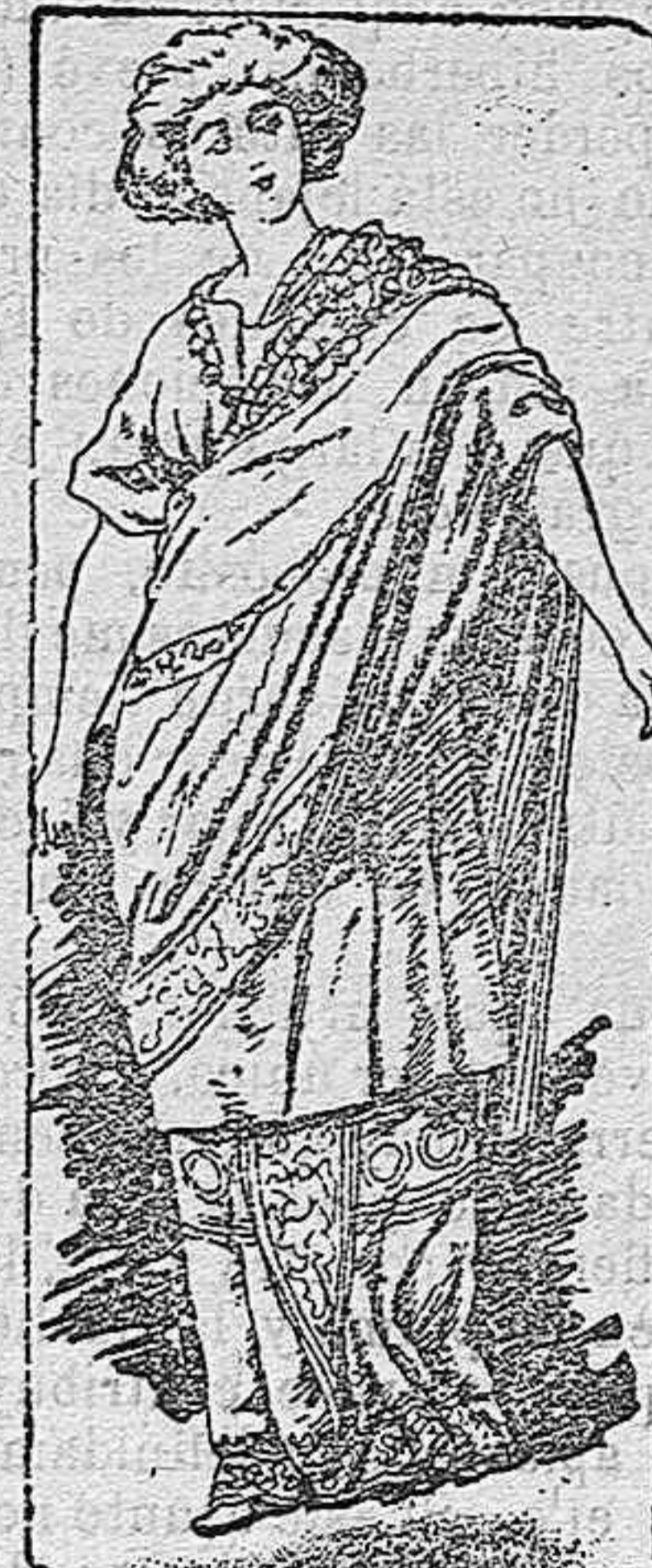
Traje de romana de la Edad Media.

Componen este disfraz una amplia túnica de damasco formando airosos pliegues con mangas cortas; media falda de seda, bordada á cenefas, adornada por delante con pedrería y oro; ancho manto de seda bordado en plata y rico collar de perlas.