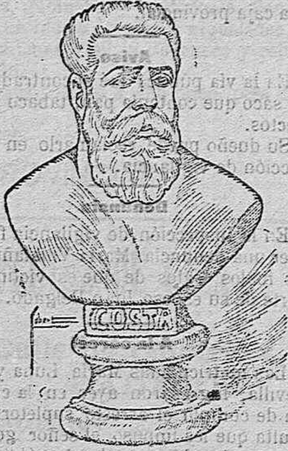
Busto en hielo del hombre de fuego