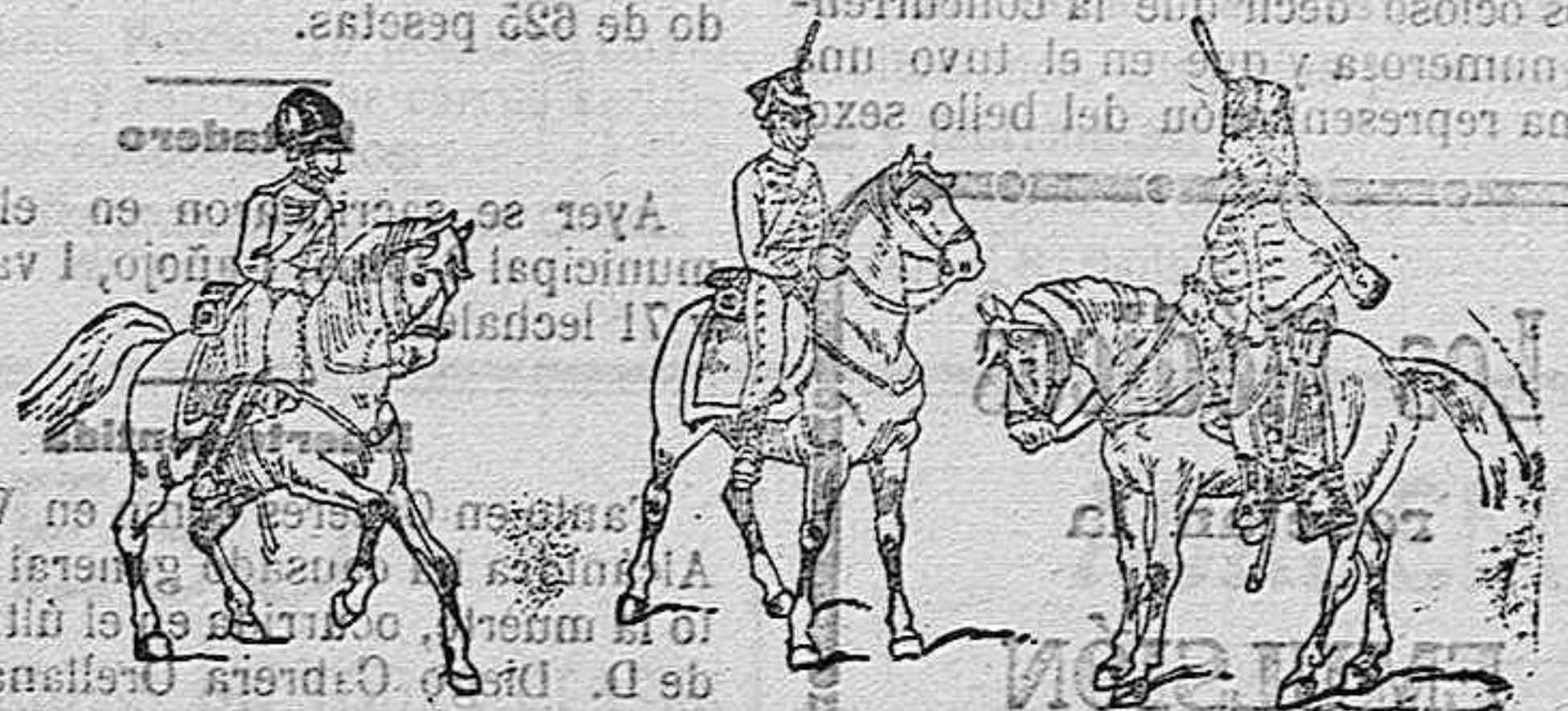
Soldados y oficial de Caballería.