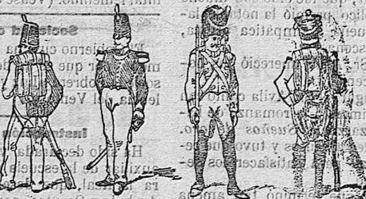
Soldado y oficial de Infantería.—Soldados de Artillería.

El Ejército español en los años 1802 á 1812