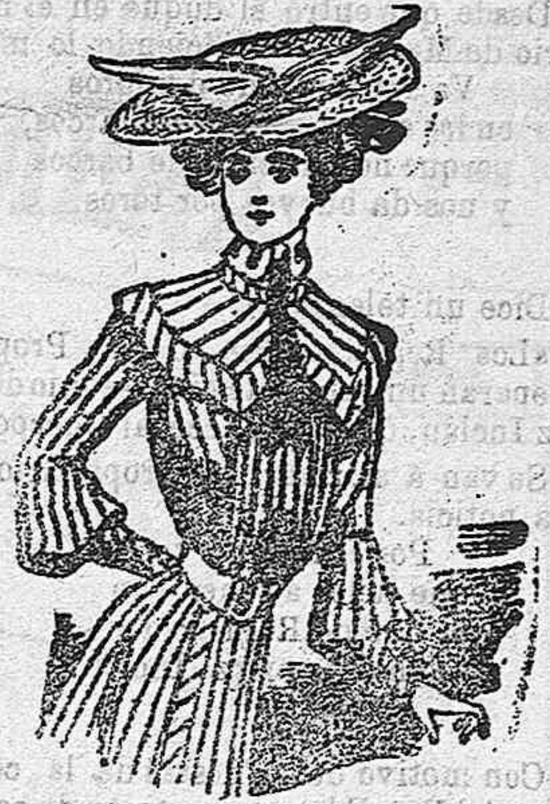
Traje de mañana.

Sencilísimo modelo del que nos ahorramos todos relato dado su poca complicación y la claridad del dibujo.